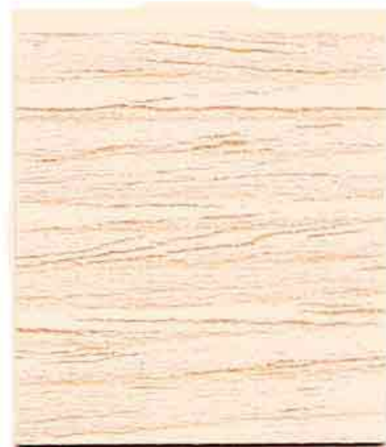
LEGNO NATURALE CHIARO

I coloranti universali per legno Woody sono compatibili con tutti i prodotti della linea, ad acqua ed a solvente. Esclusivi ed innovativi, possono essere abbinati tra loro per ottenere infinite tonalità personalizzate a piacere.