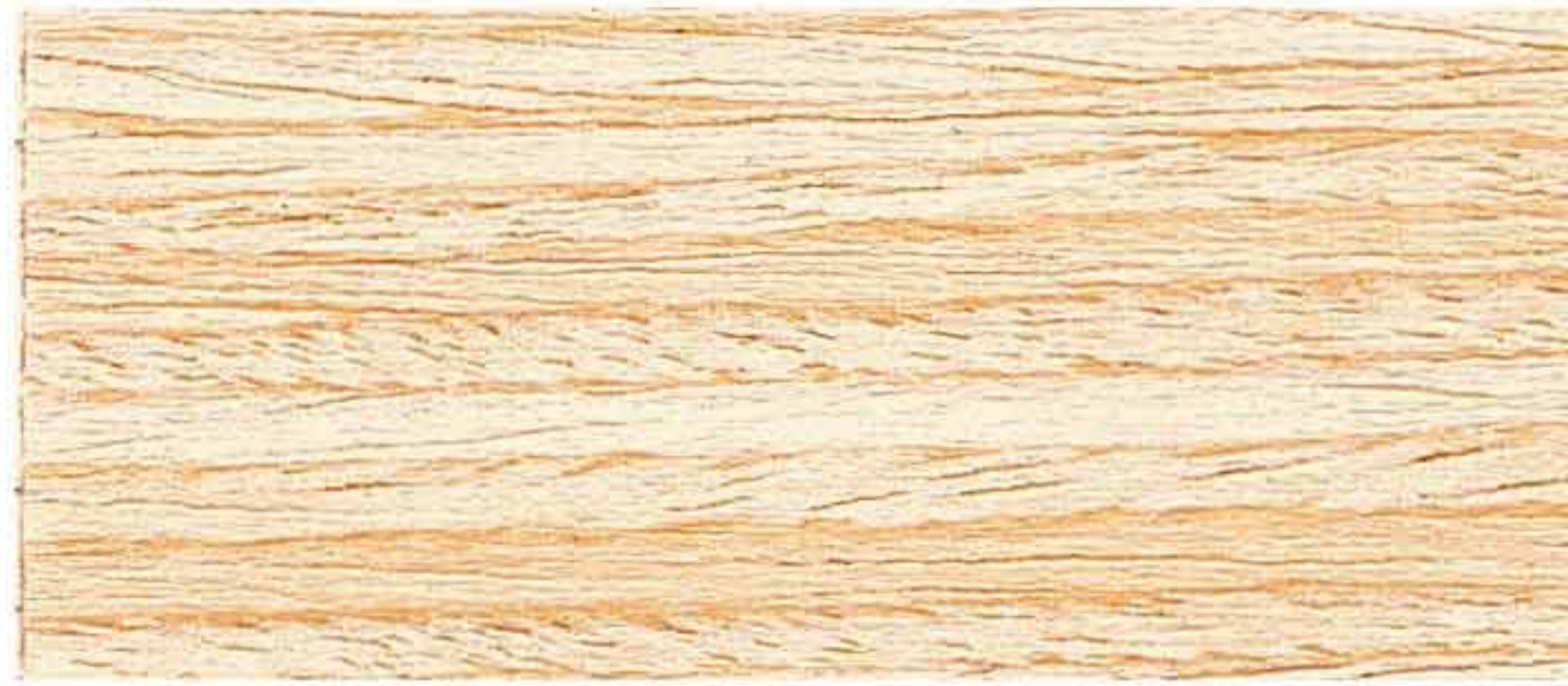
IMPREGNANTE AD ACQUA