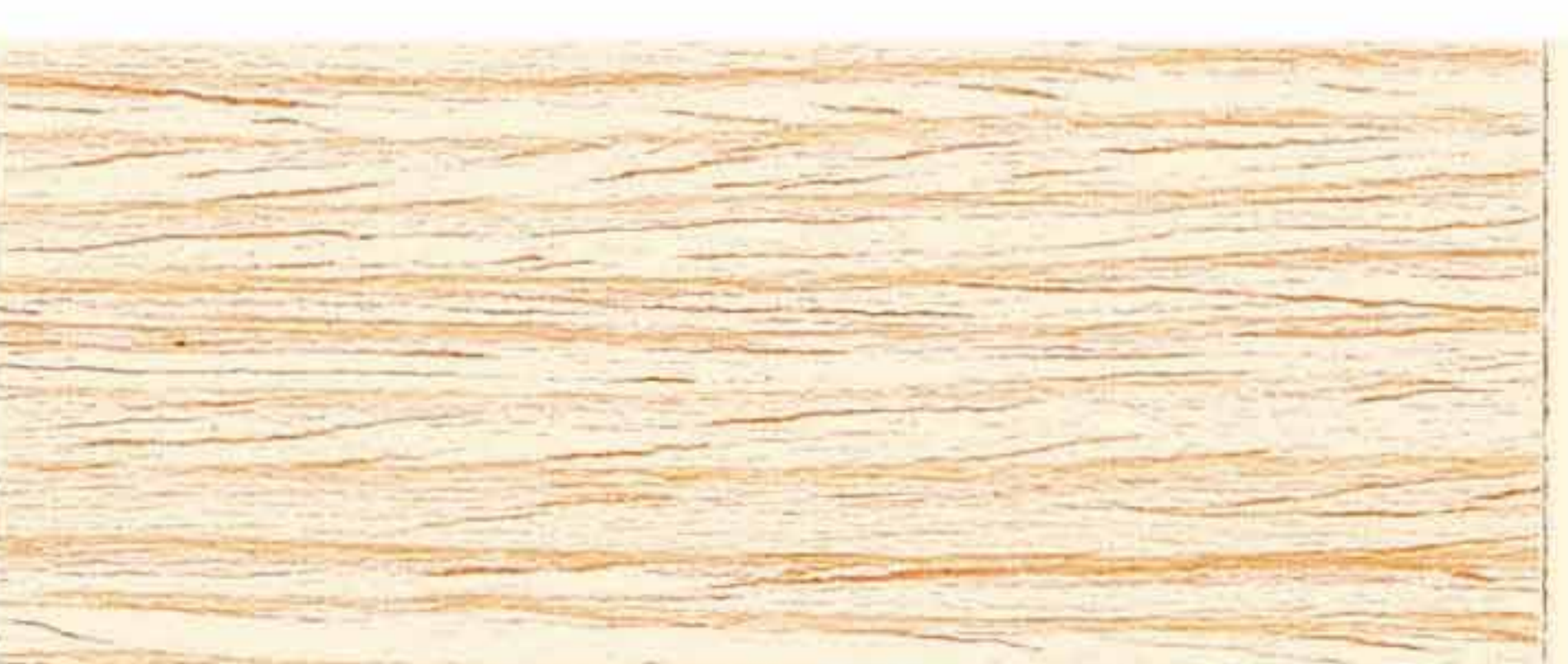
CERA NATURALE D'API