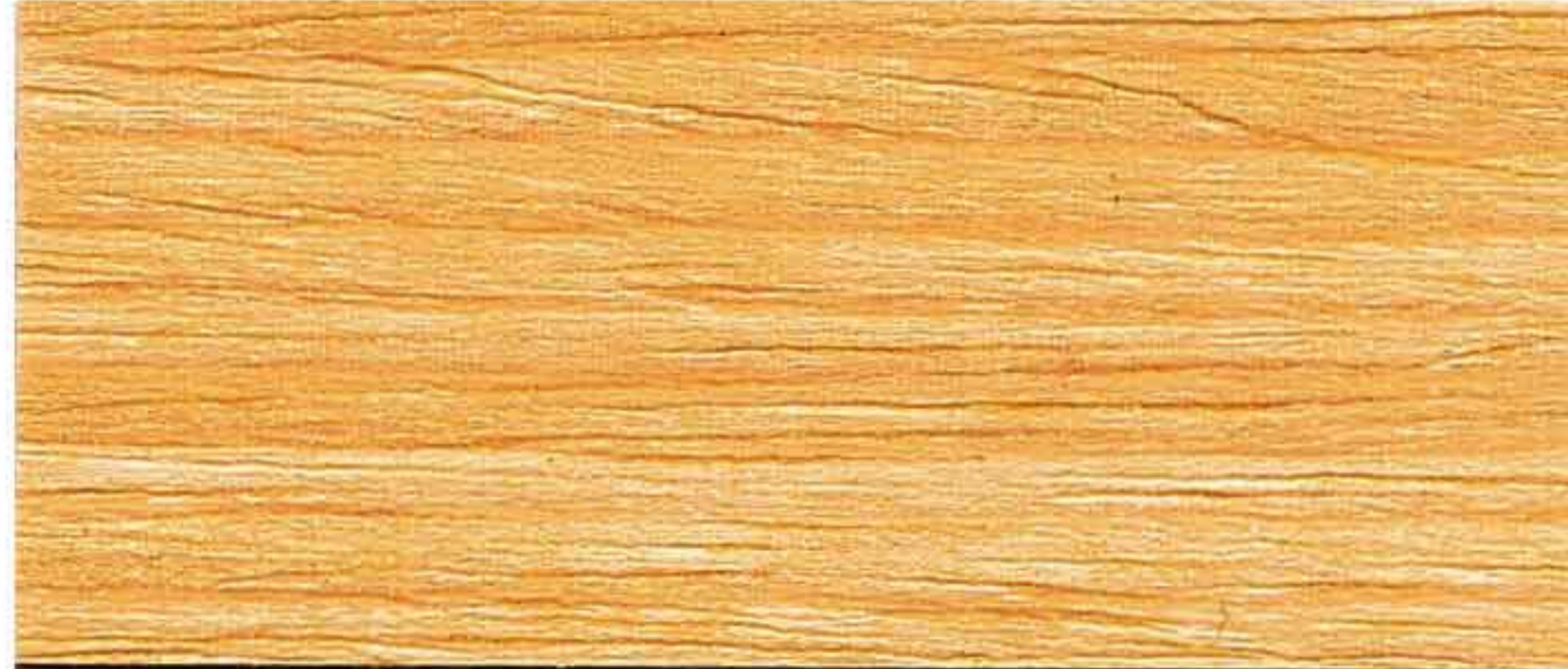
BOAT FINISH VARNISH