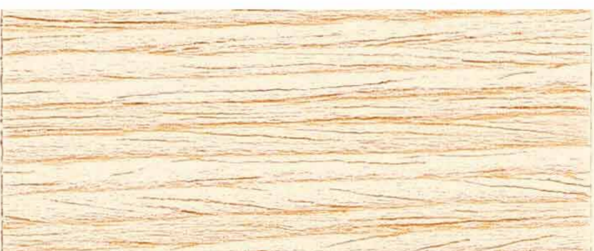
FONDO TURAPORI AD ACQUA