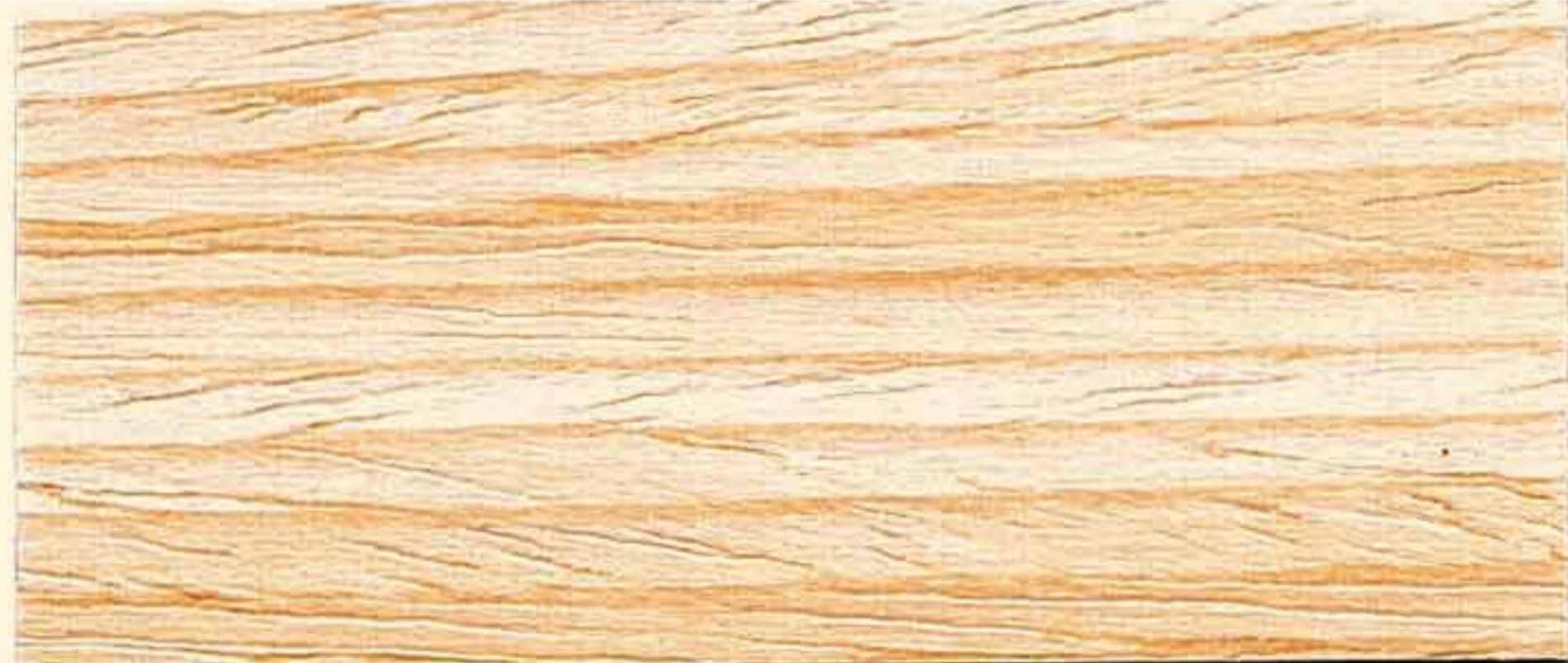
FLATTING AD ACQUA