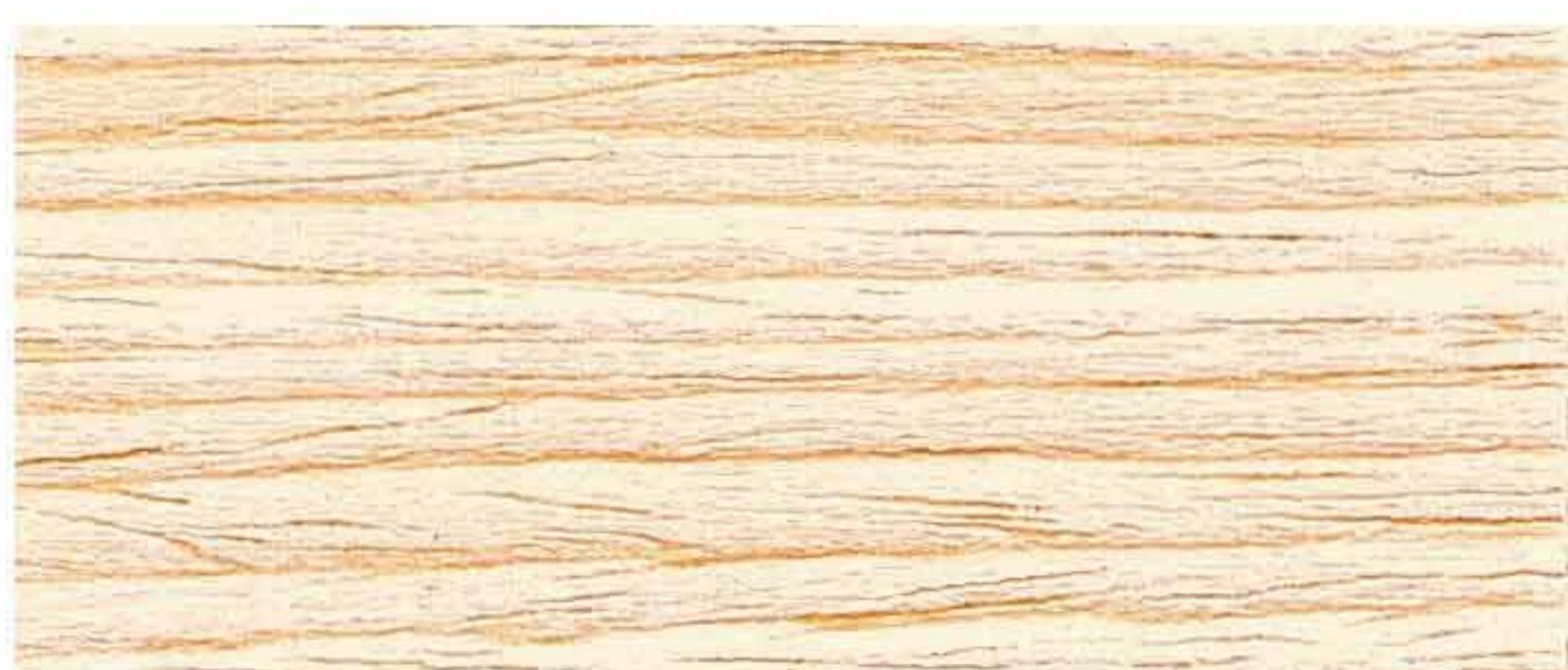
VERNICE POLIURETANCA SATINATA AD ACQUA