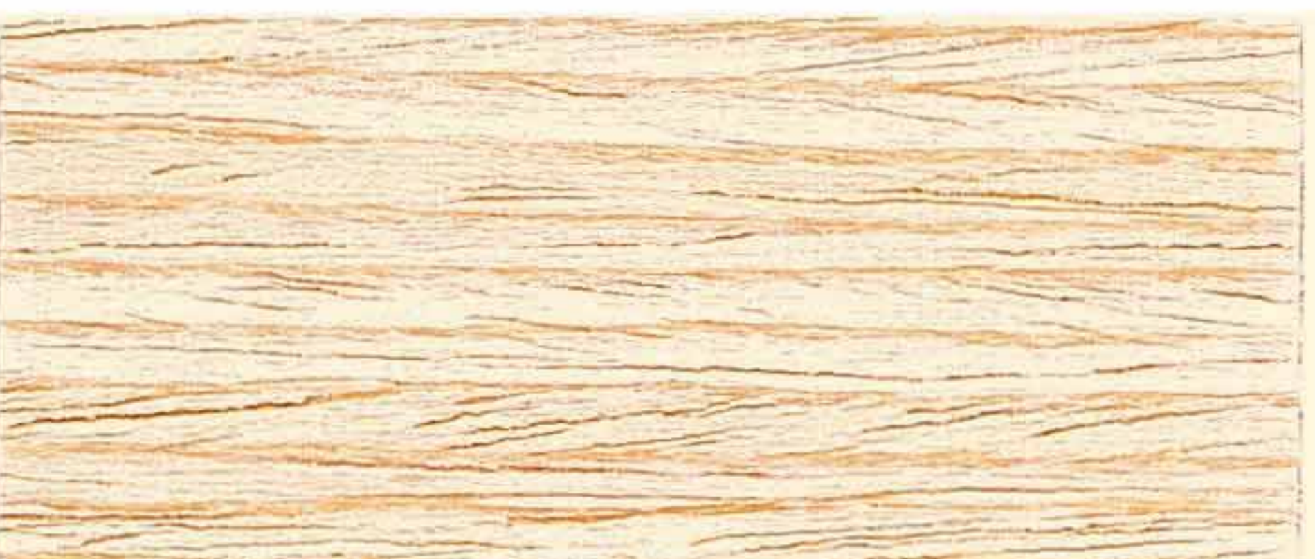
CERA RIGENERANTE AD ACQUA