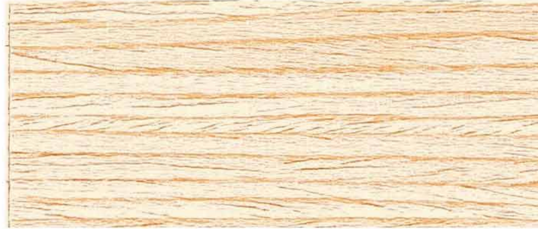
FINITURA CERATA AD ACQUA