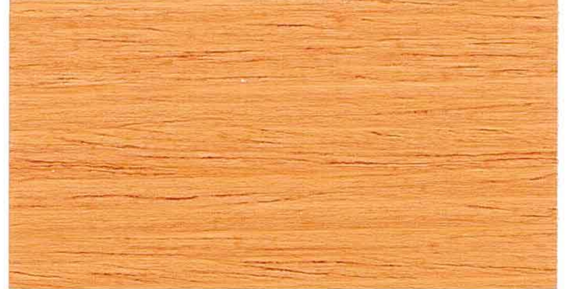
DOUGLAS 2° MANO