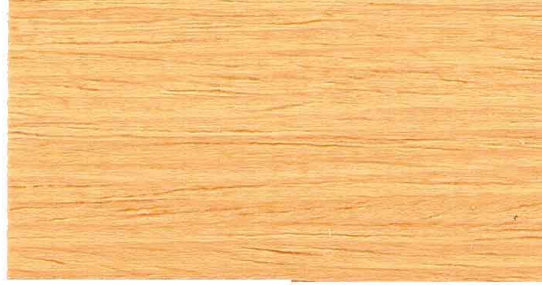
PINO 2° MANO