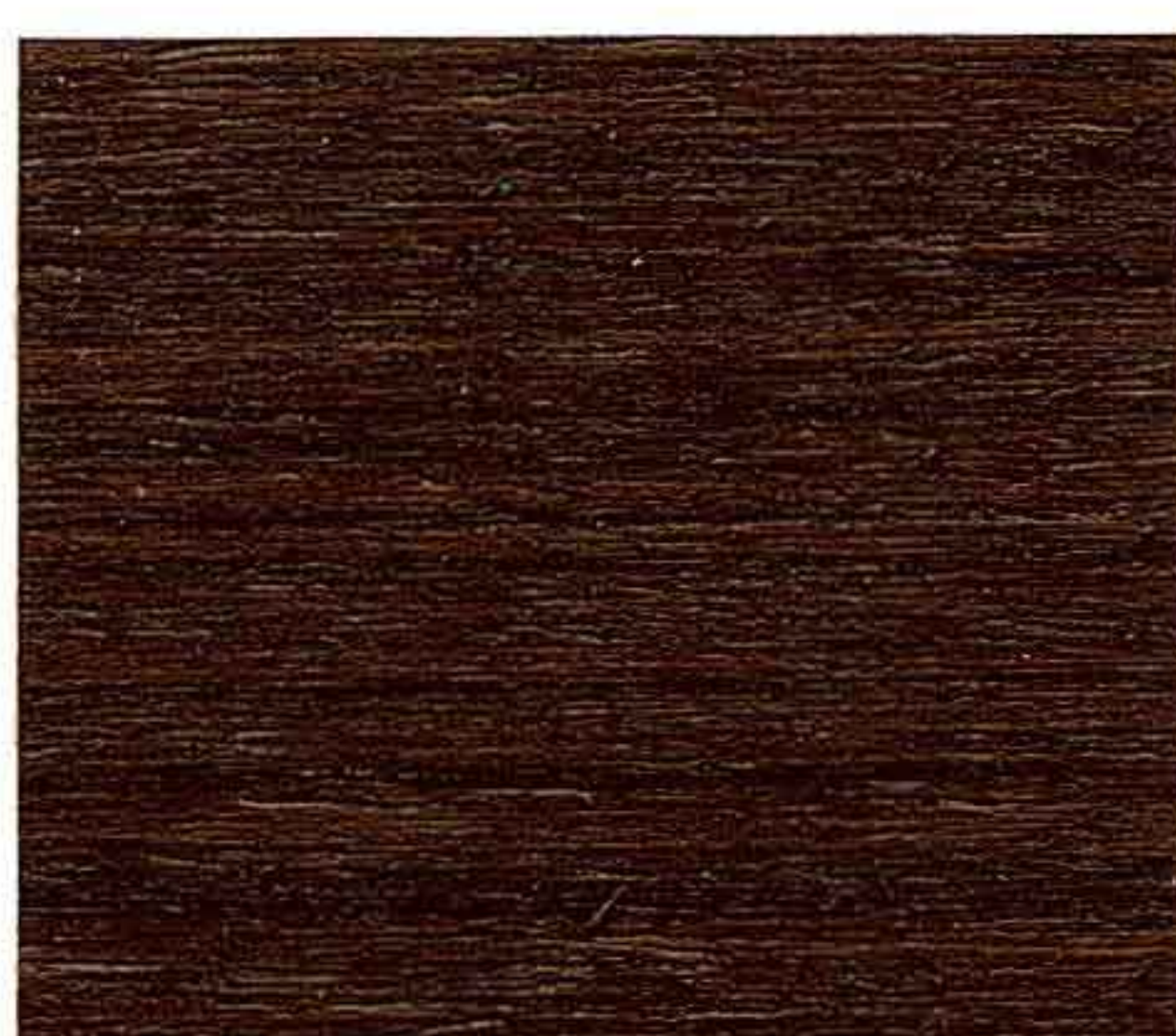
NOCE CHIARO 2° MANO

Il risultato estetico finale, specie per i colori più chiari, può subire variazioni anche notevoli in funzione di: