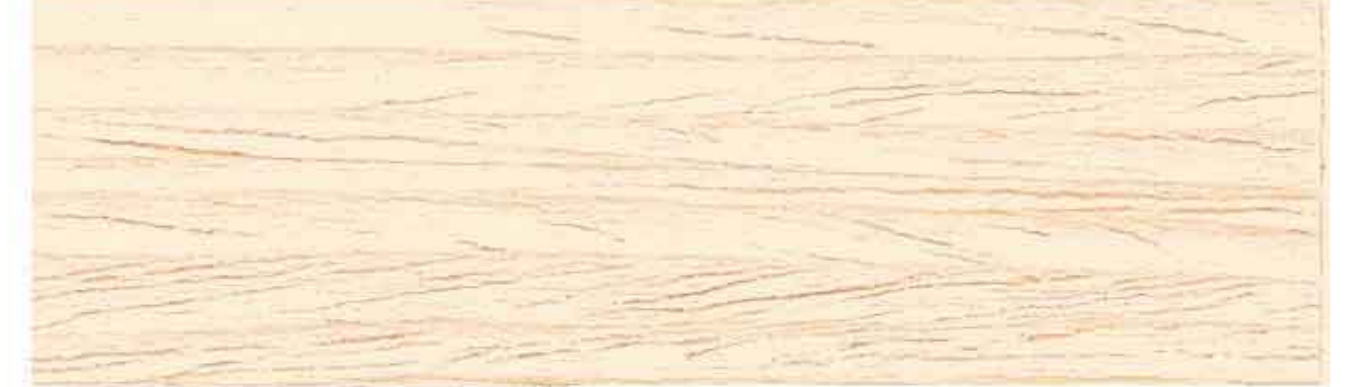
LEGNO NATURALE CHIARO