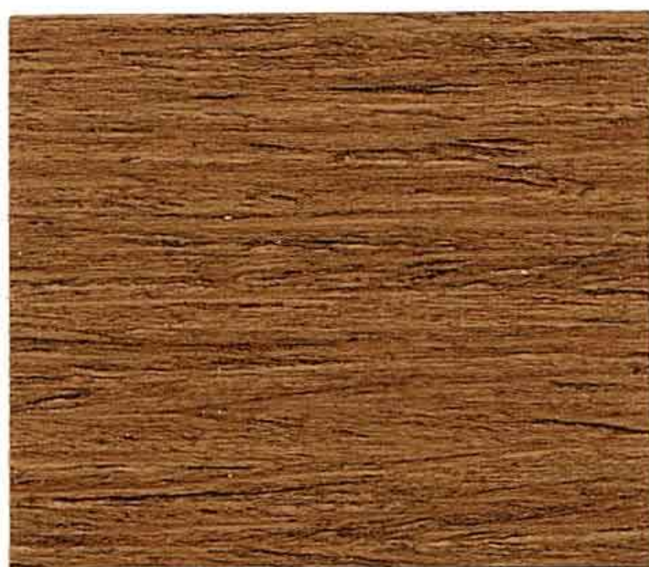
NOCE CHIARO 1° MANO