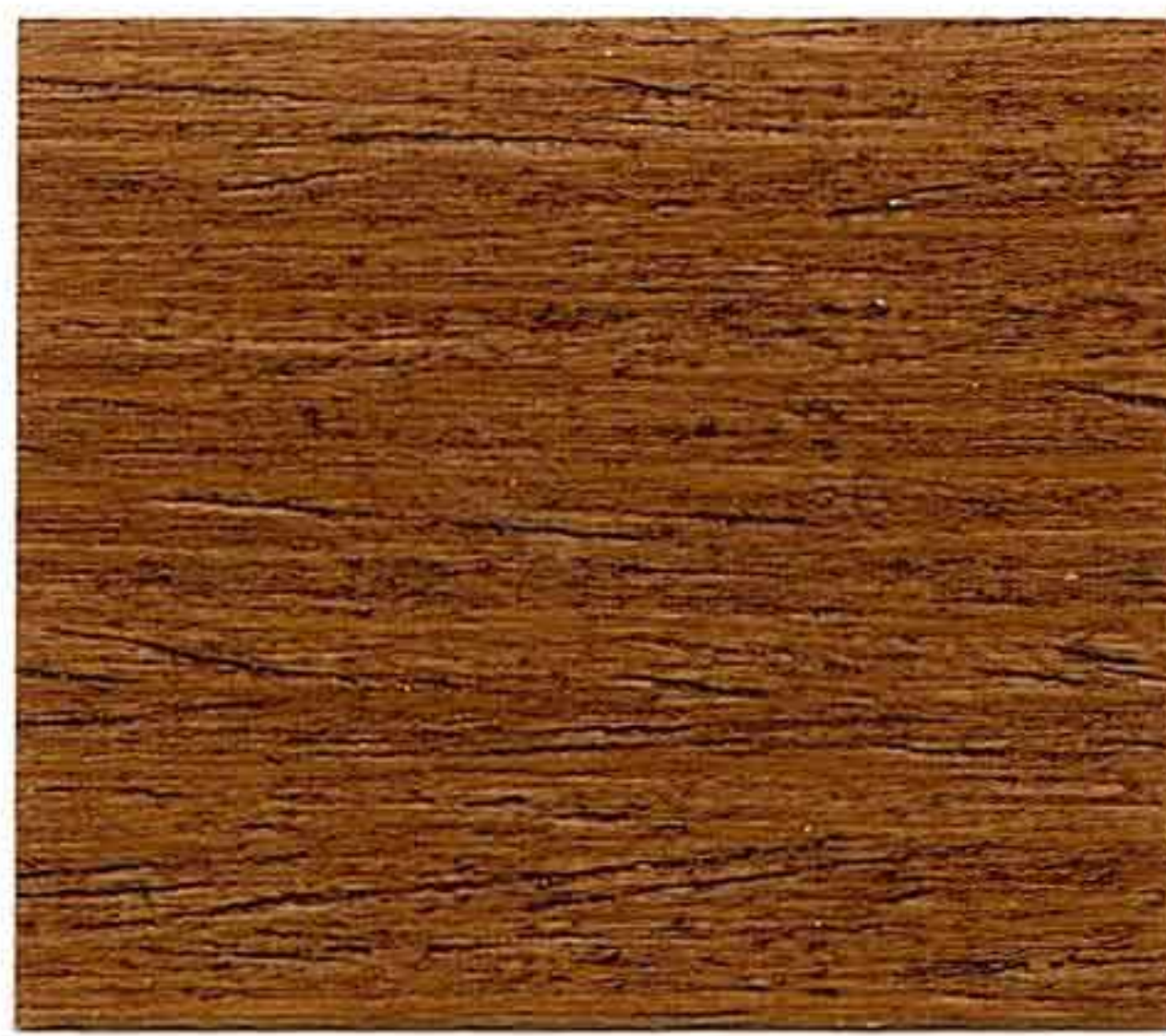
NOCE CHIARO 2° MANO