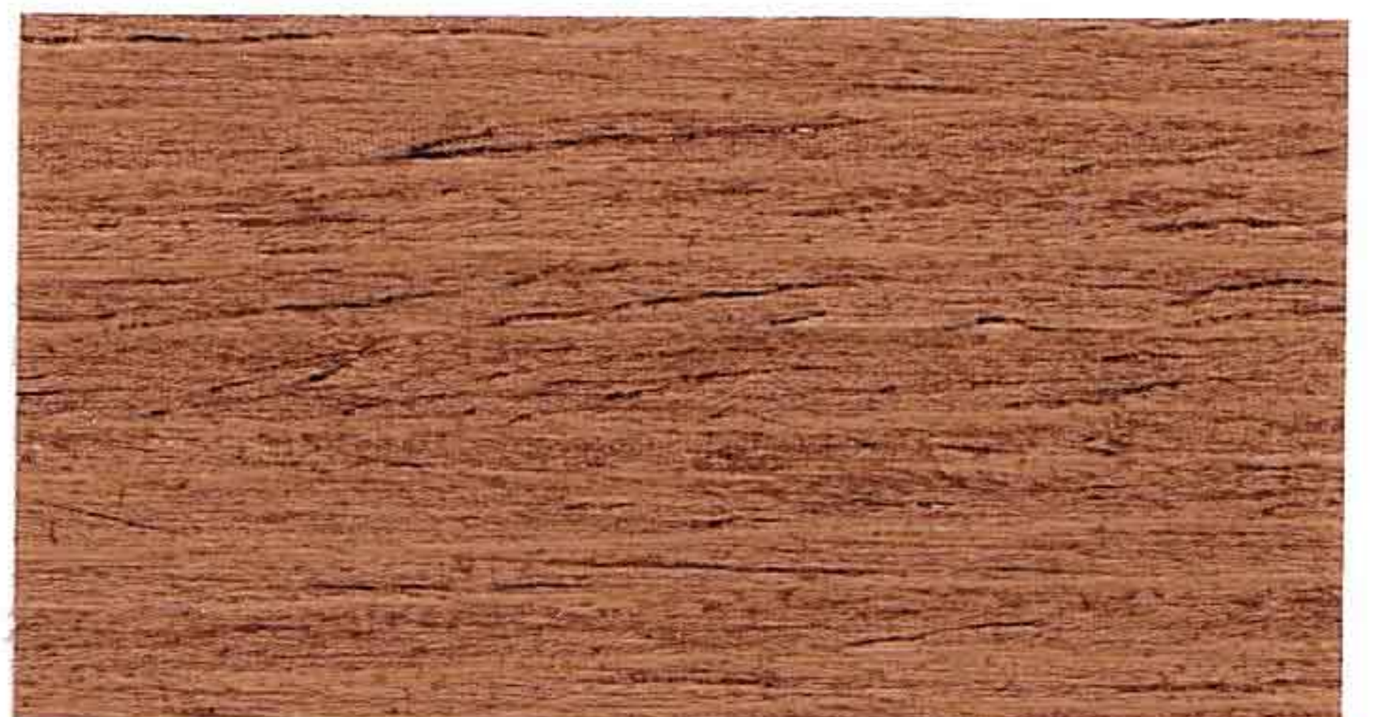
NOCE CHIARO 1° MANO