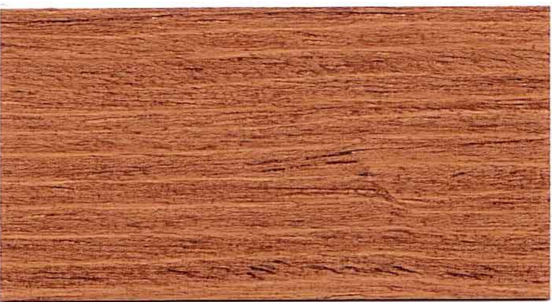
CASTAGNO 1° MANO