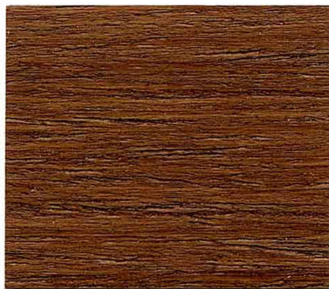
NOCE CHIARO 2° MANO