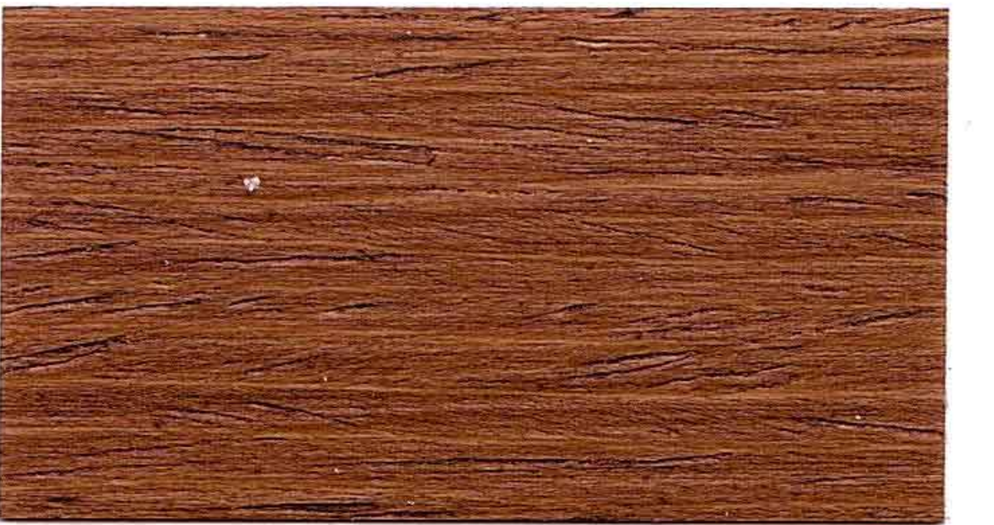
NOCE CHIARO 2° MANO