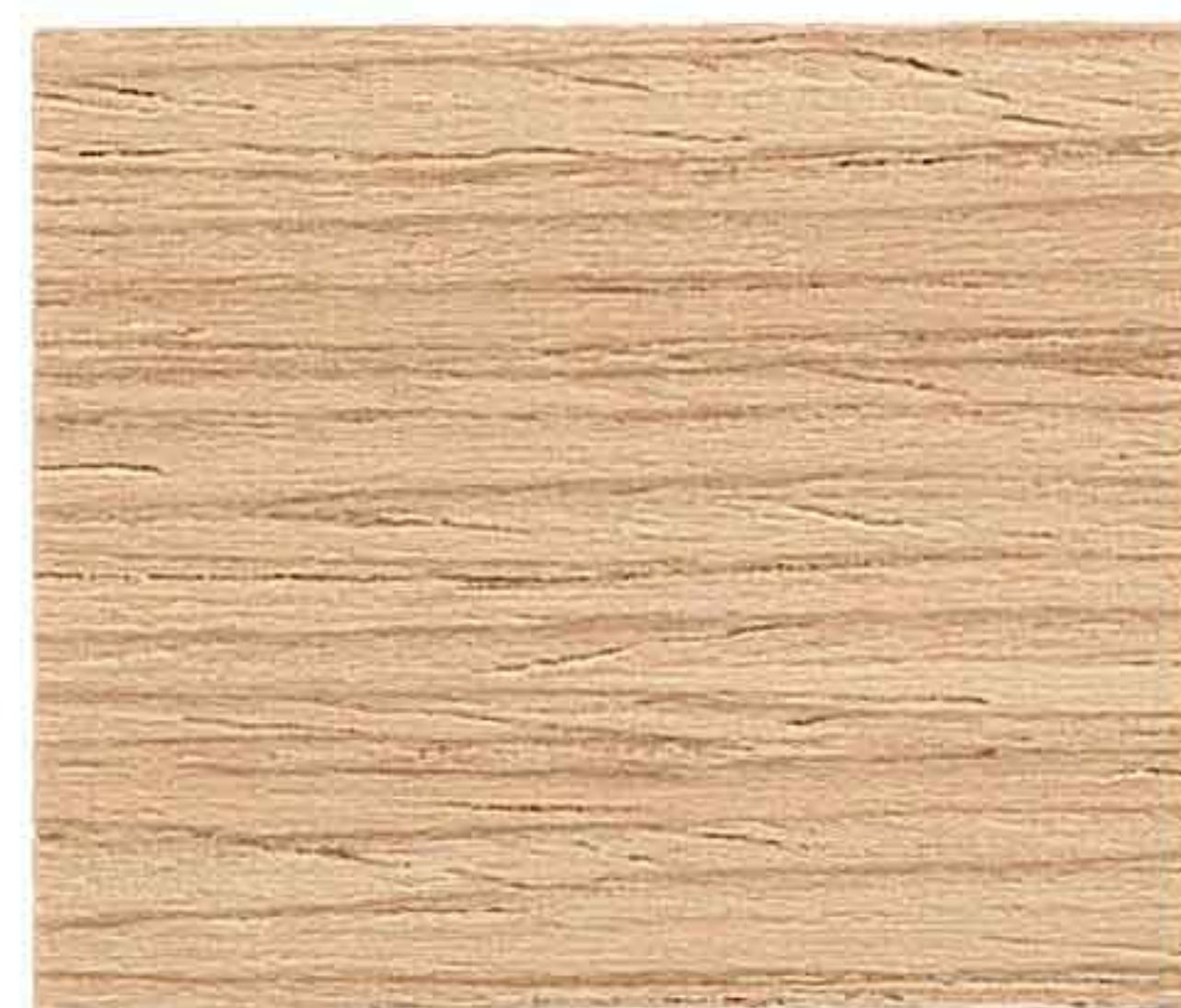
LEGNO NATURALE MEDIO