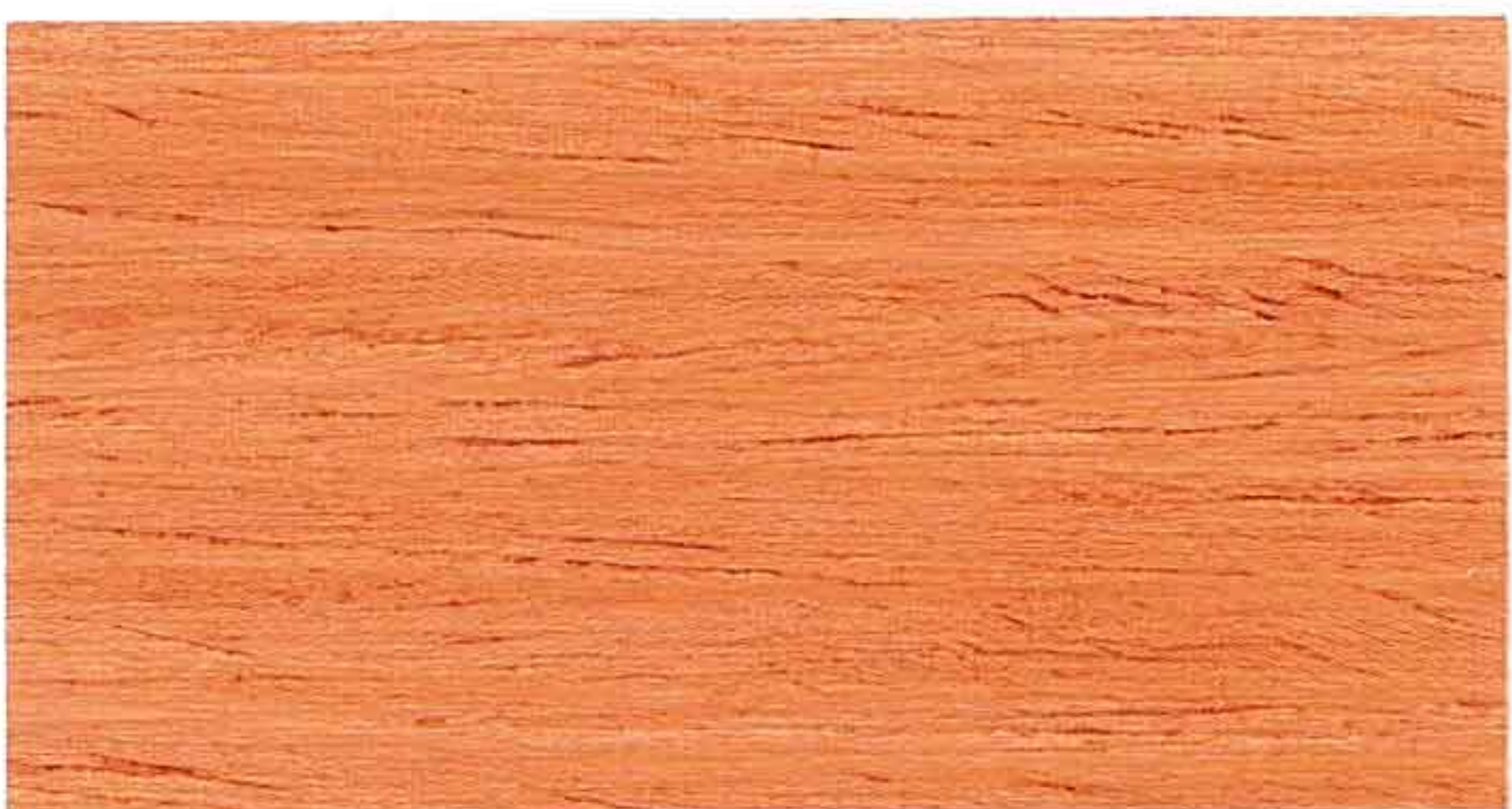
RED WOOD 1° MANO