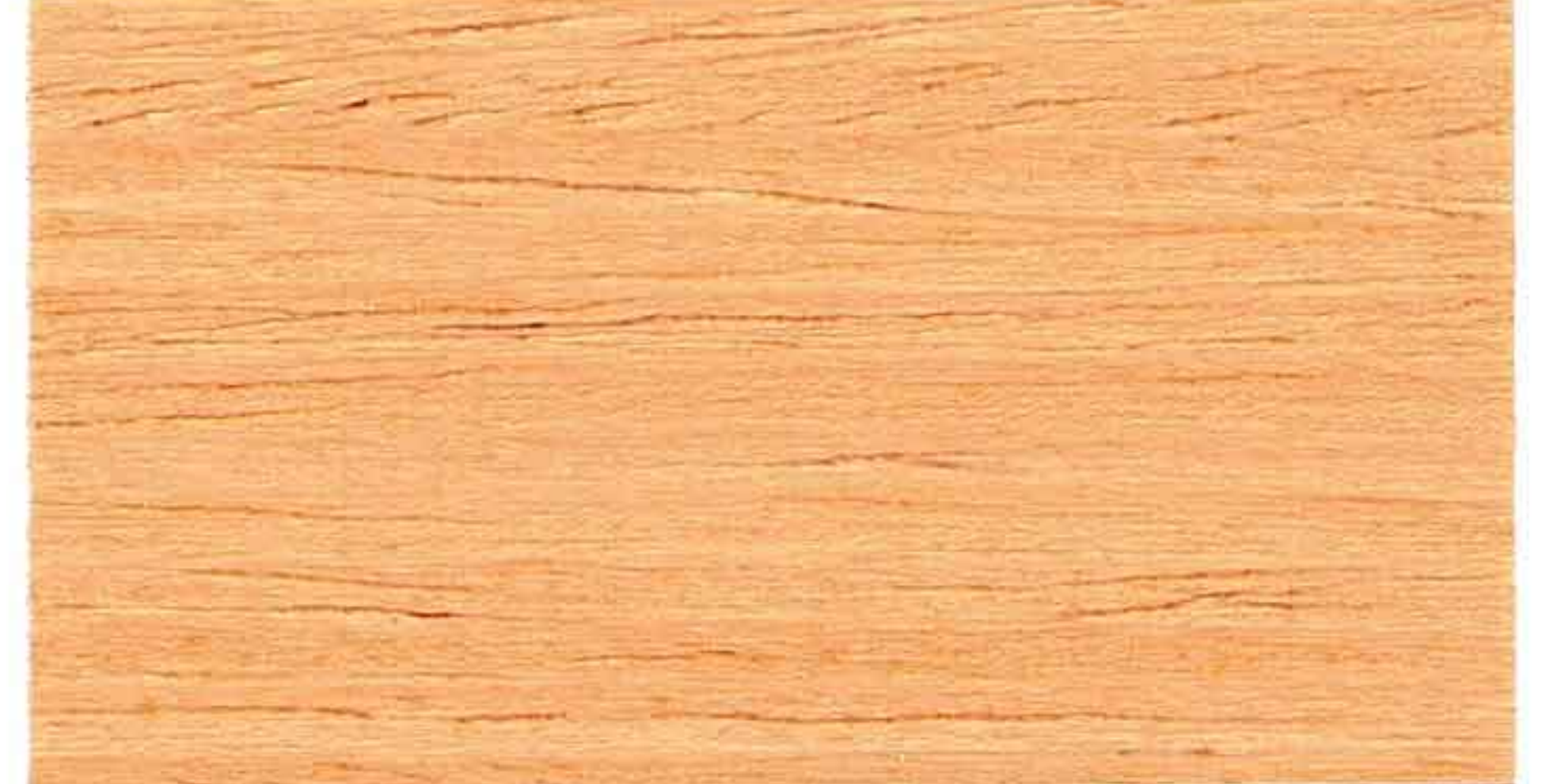
DOUGLAS 1° MANO