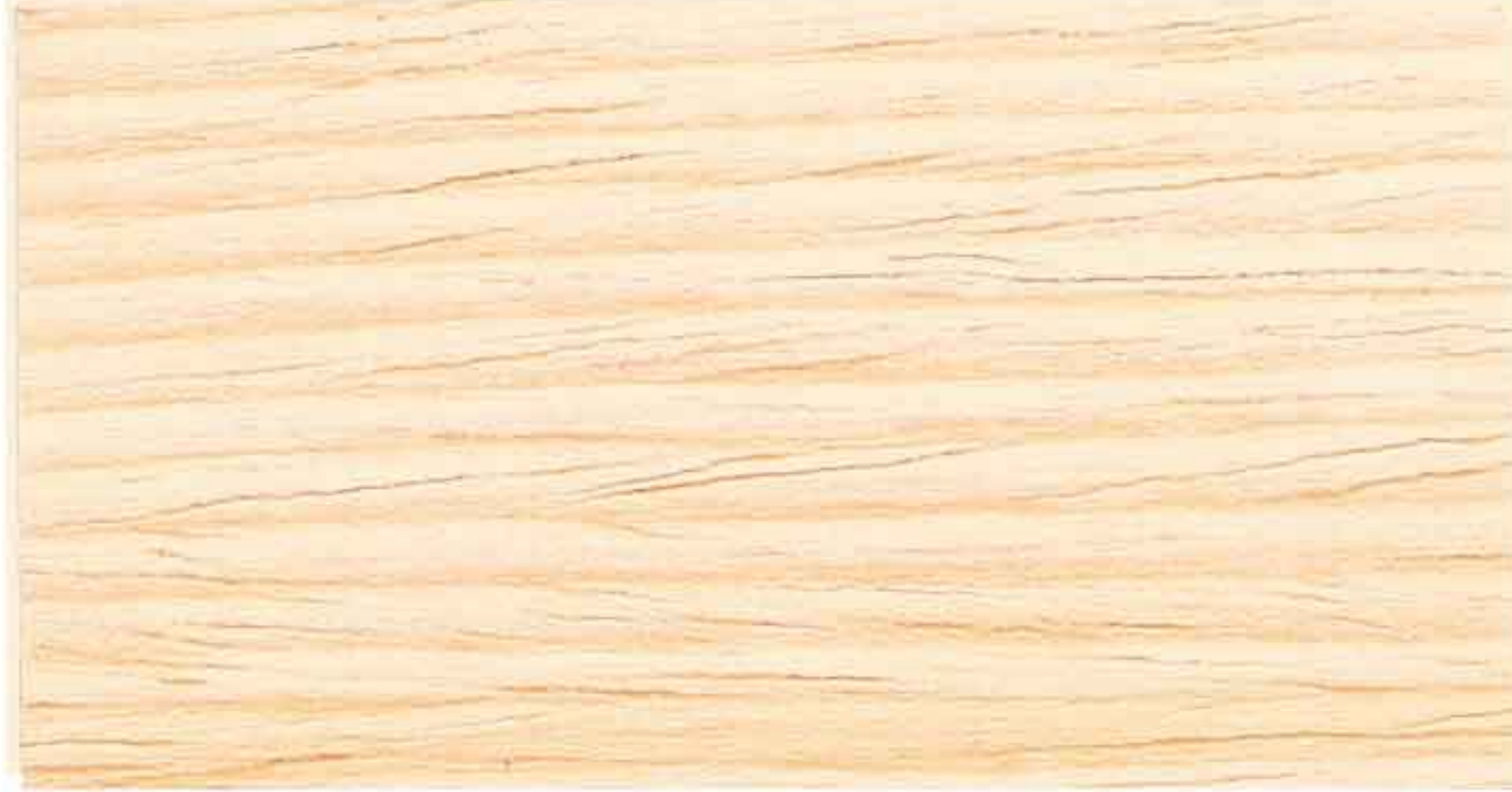
INCOLORE 1° MANO