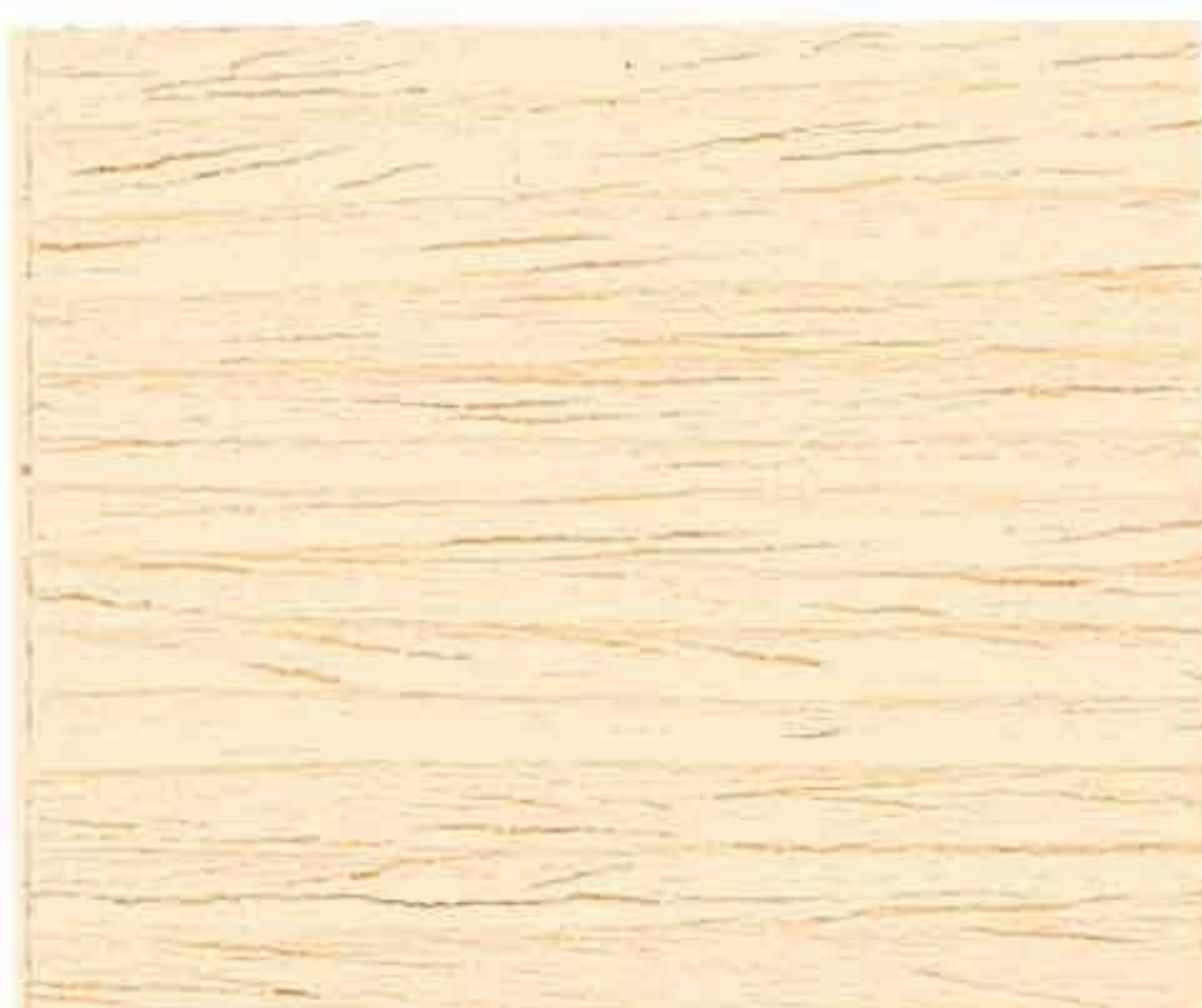
LEGNO NATURALE CHIARO

ПРОДУКТИВНОСТЬ НА РАЗЛИЧНЫХ ТИПАХ ДЕРЕВА - YIELD ON DIFFERENT TYPES OF WOOD - RENDEMENTS DIFFERENTS TYPES DE BOIS ERGIEBIGKEIT AUF VERSCHIEDENEN HOLZARTEN - RENDIMIENTO EN DIFERENTES TIPOS DE MADERA RANDAMENTUL PENTRU DIFERITE TIPURI DE LEMN - ΑΠΟΔΟΣΗ ΣΕ ΔΙΑΦΟΡΕΤΙΚΟΥΣ ΤΥΠΟΥΣ ΞΥΛΟΥ