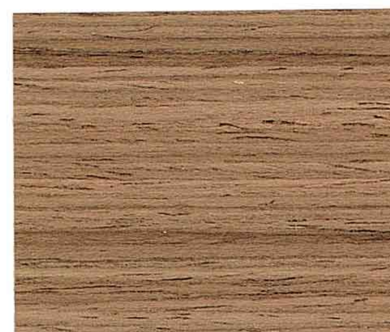
LEGNO NATURALE SCURO