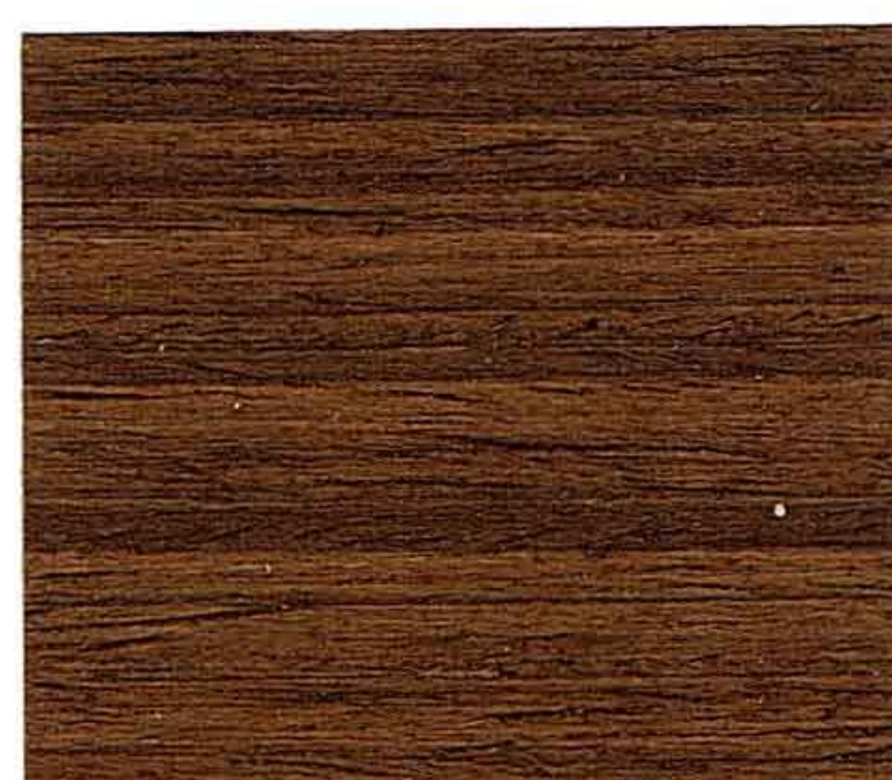
NOCE CHIARO 1° MANO