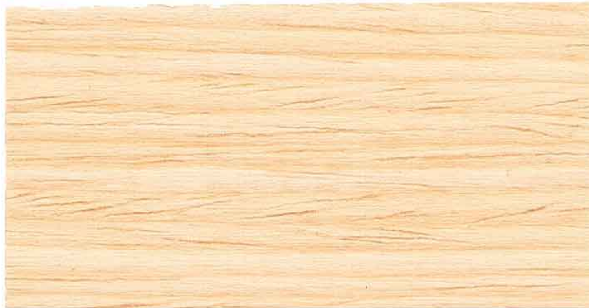
INCOLORE 2° MANO