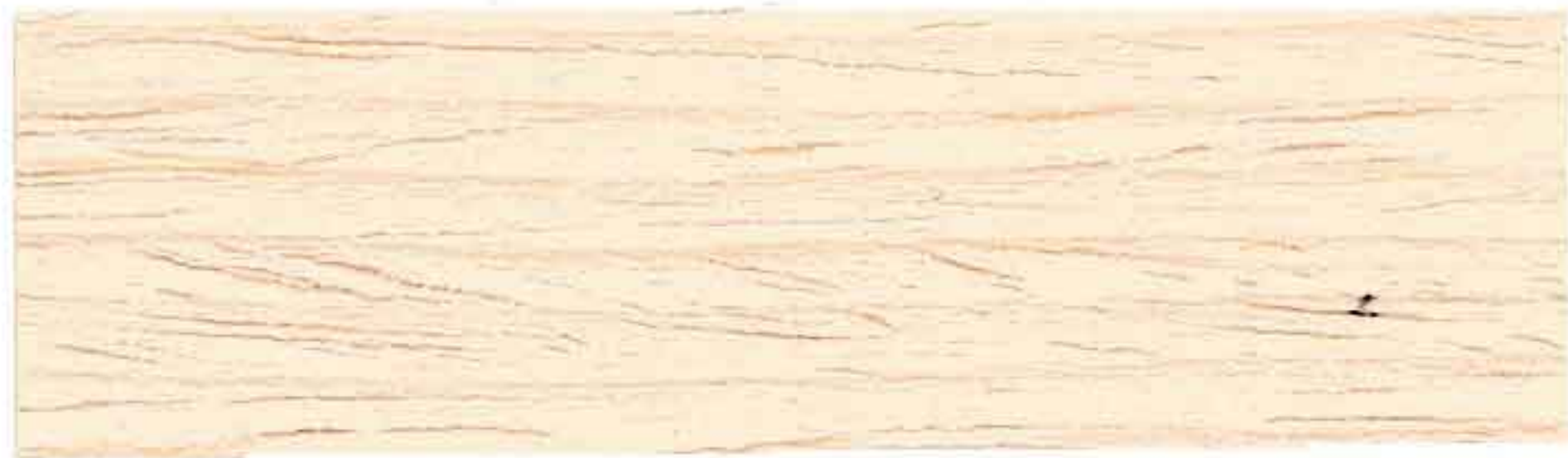
LEGNO NATURALE CHIARO

ГОТОВЫЕ ЦВЕТА - READY-MADE SHADES - COULEURS DEJA PRETES - GEBRAUCHSFERTIGE FARBEN COLORES YA LISTOS - CULORI GATA DE UTILIZARE - ΕΤΟΙΜΕΣ ΑΠΟΧΡΩΣΕΙΣ