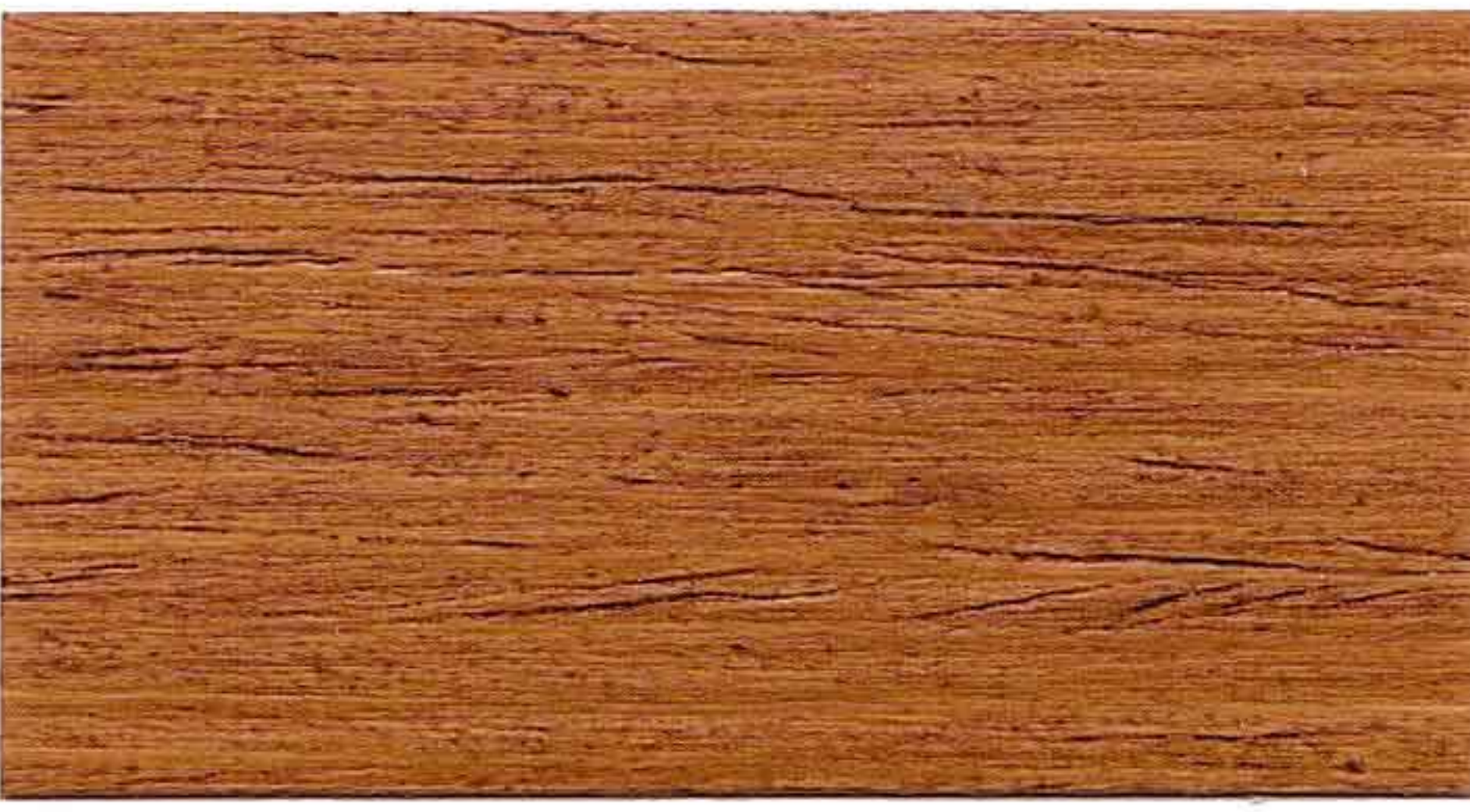
ROVERE 2° MANO