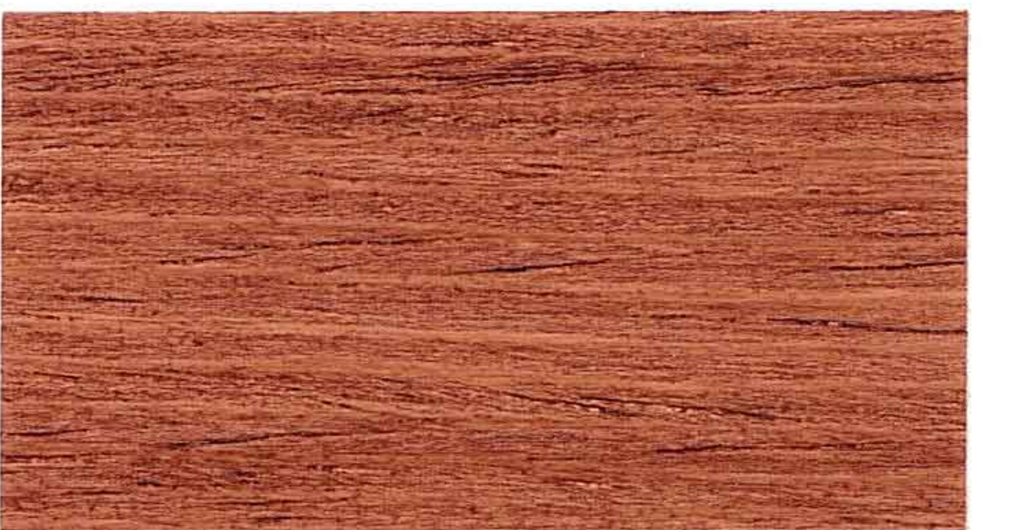
MOGANO 1° MANO