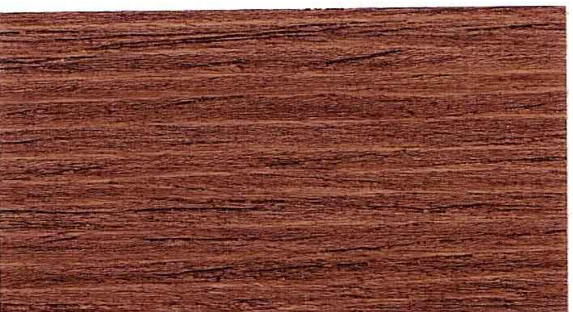
NOCE SCURO 1° MANO