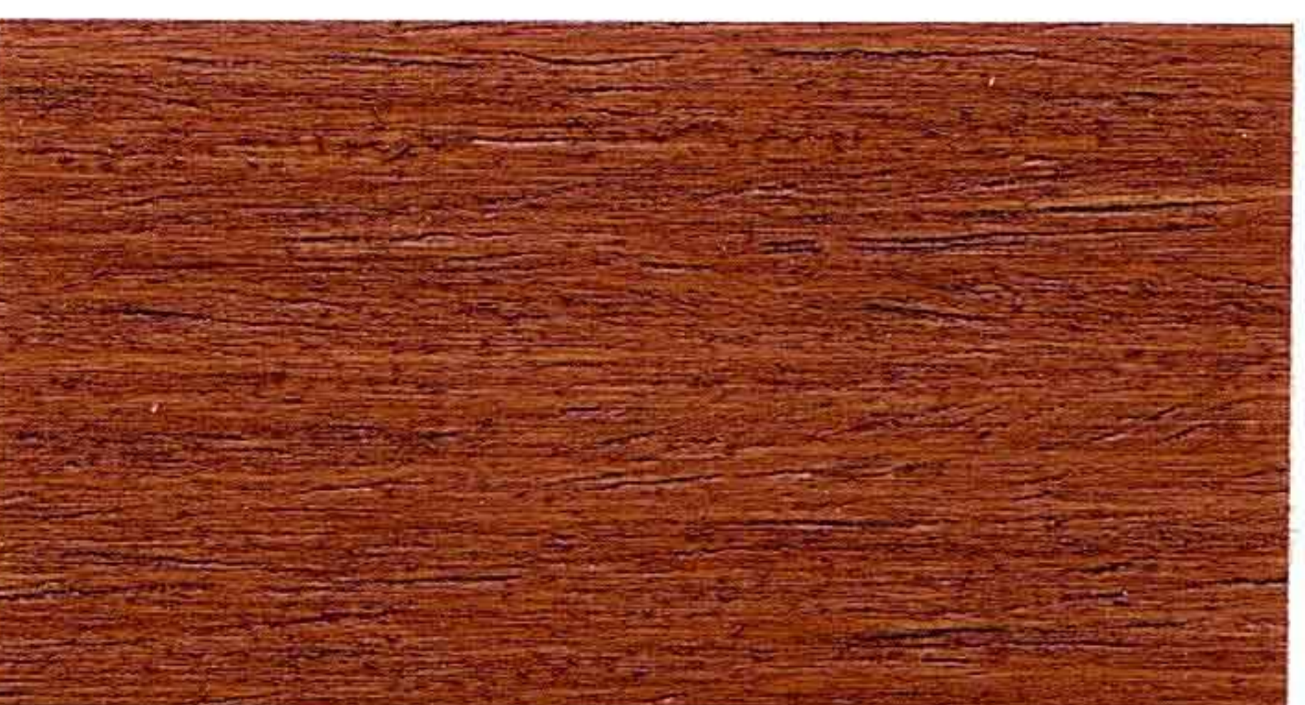
CASTAGNO 2° MANO