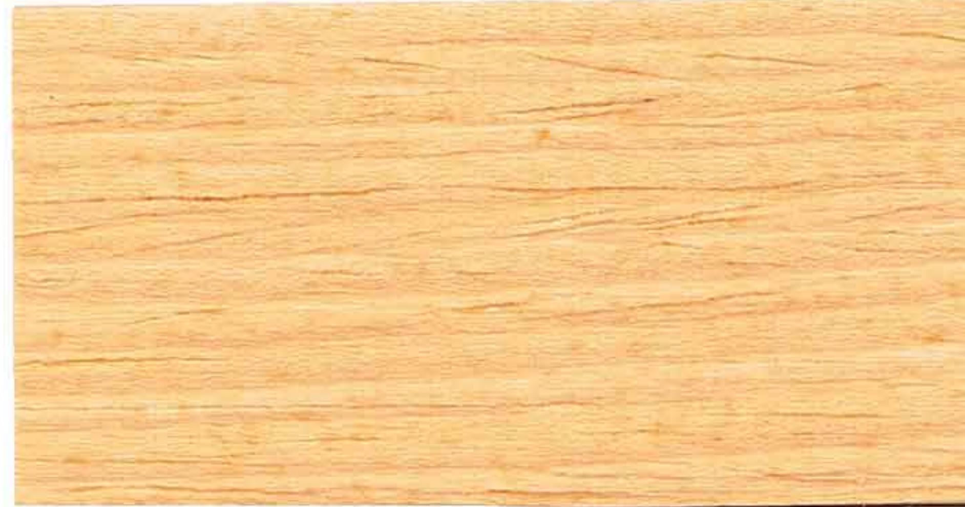
PINO 1° MANO