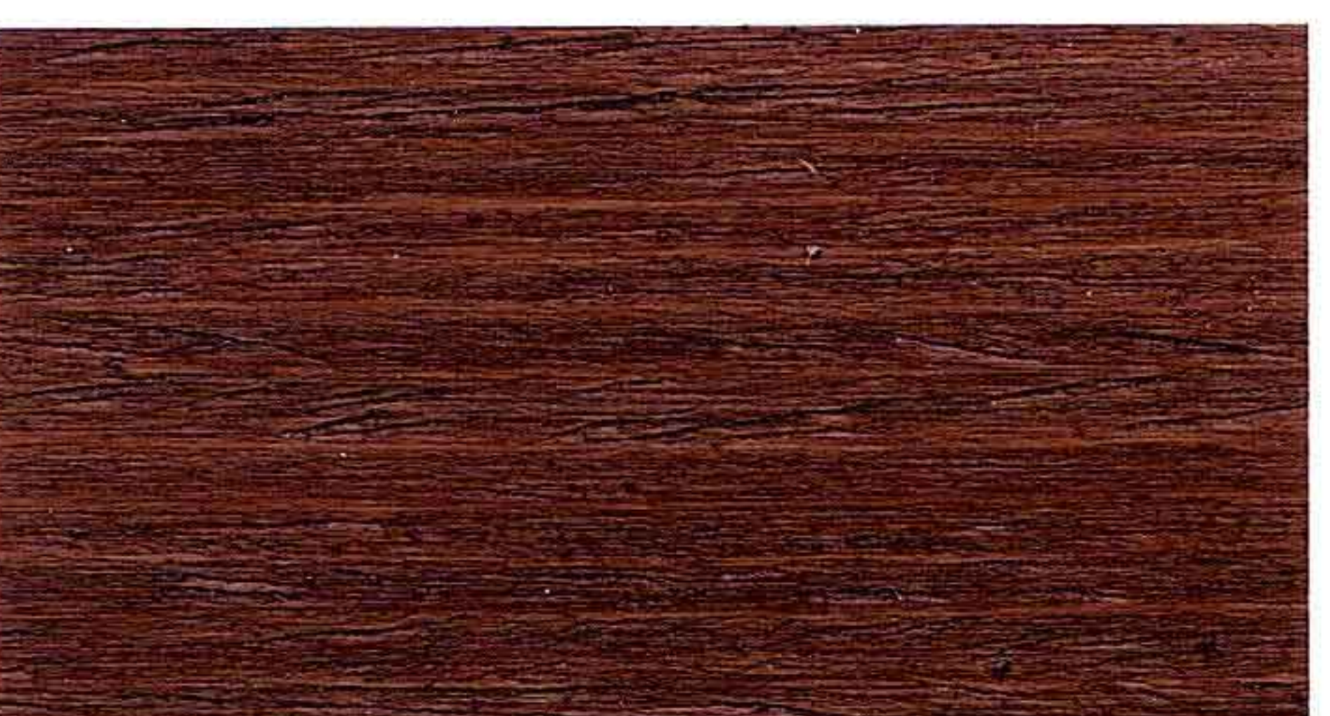
NOCE SCURO 2° MANO