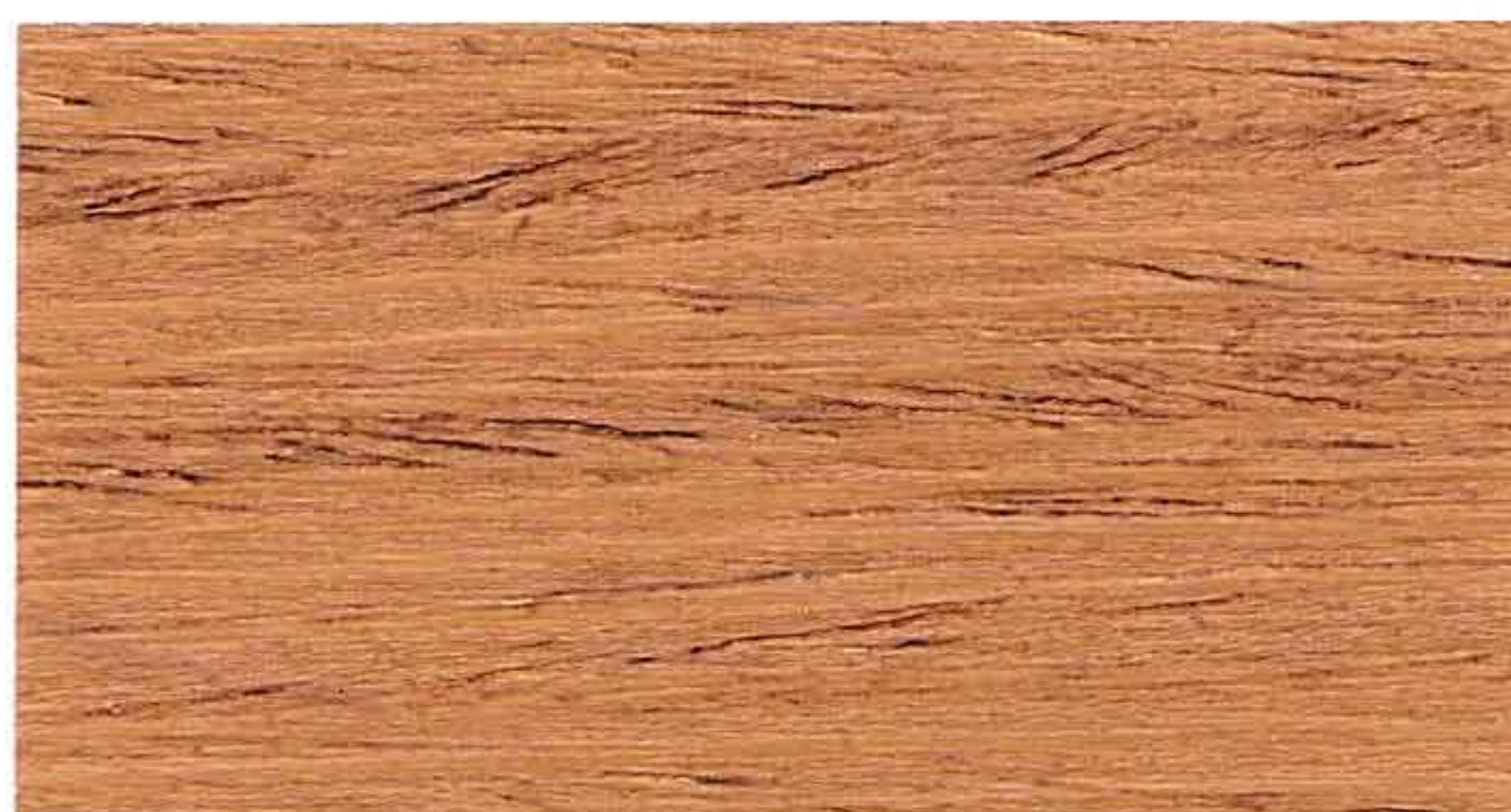
ROVERE 1° MANO