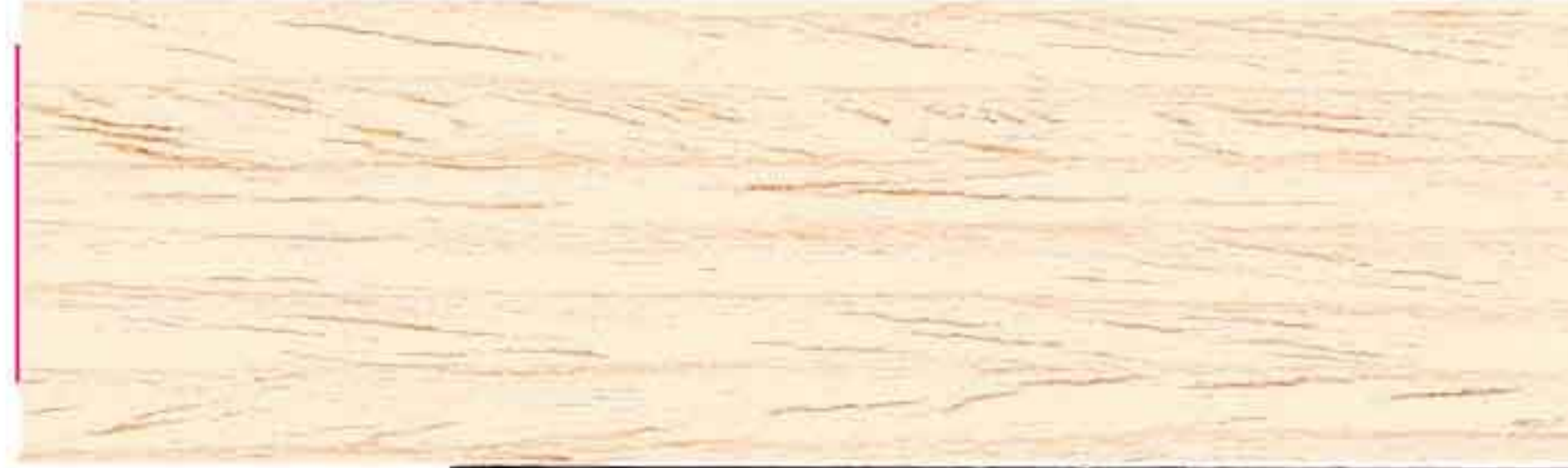
LEGNO NATURALE CHIARO