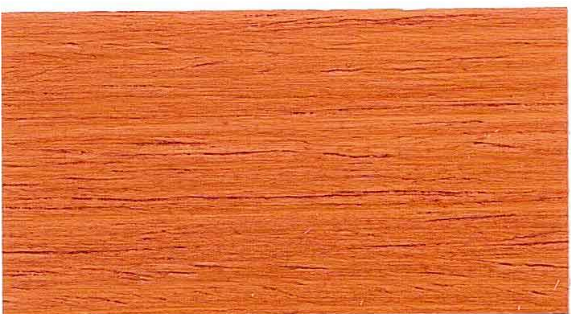
RED WOOD 2° MANO