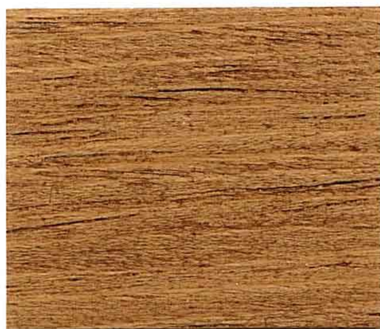
NOCE CHIARO 1° MANO