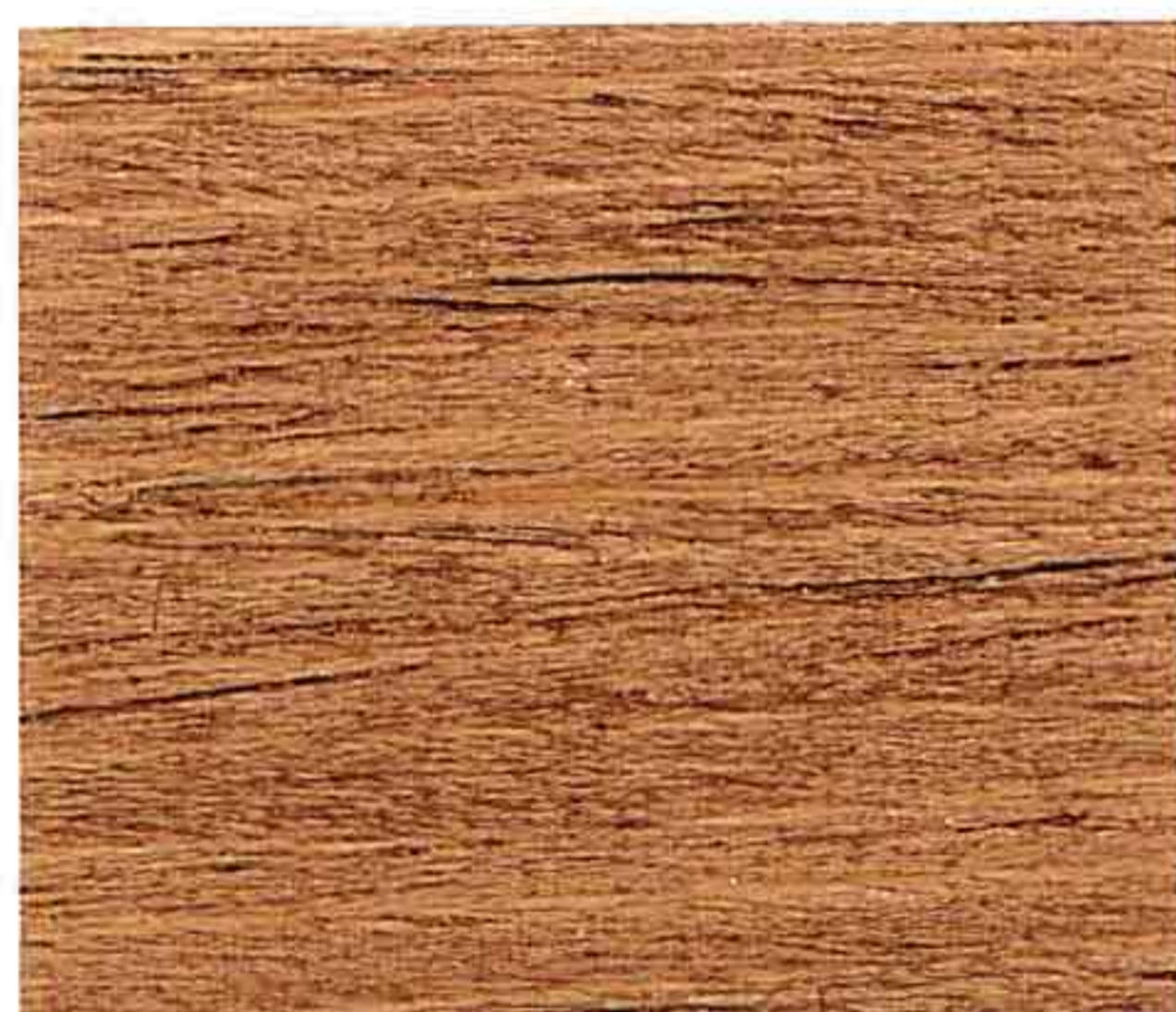
NOCE CHIARO 1° MANO