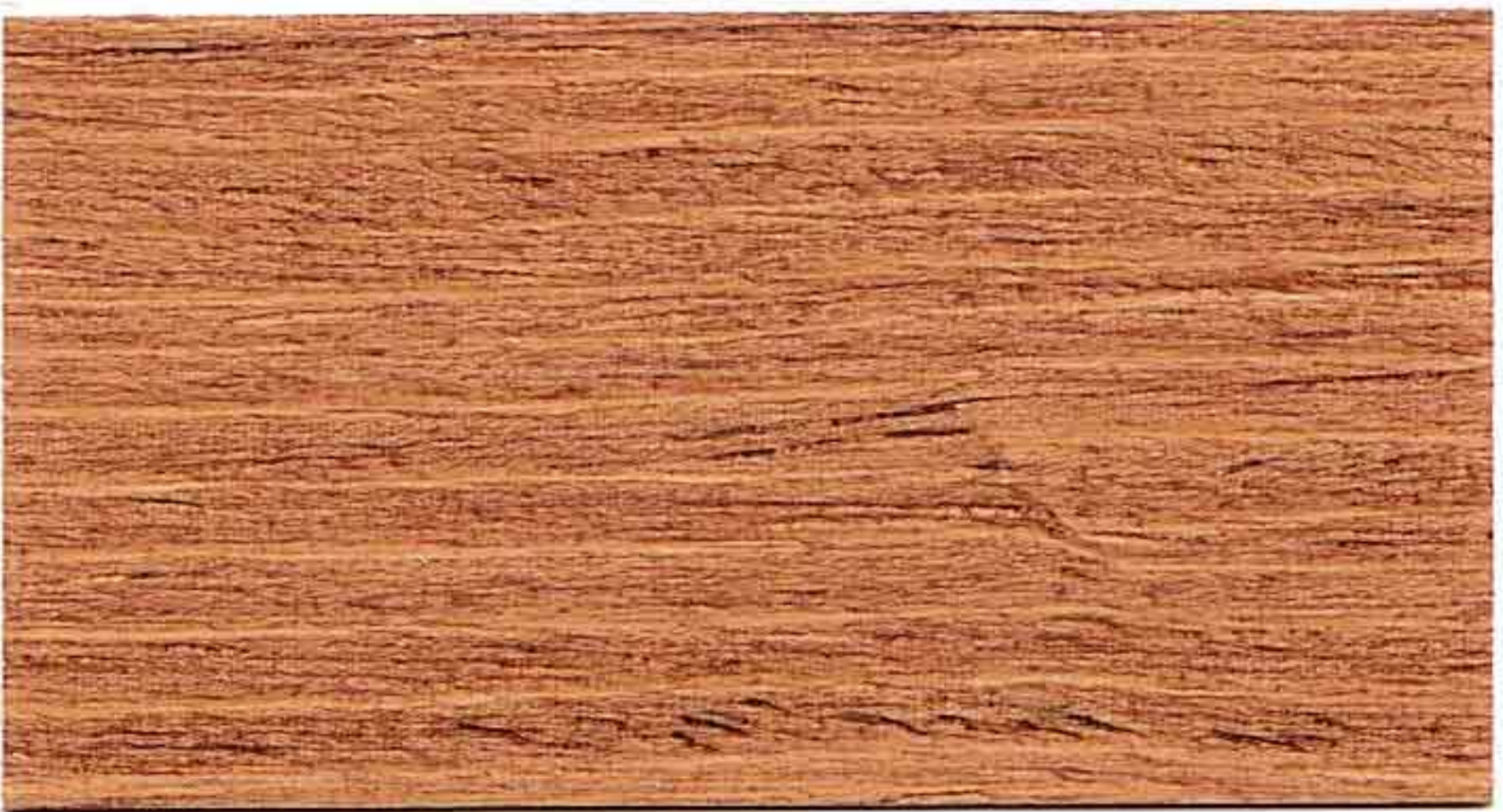
CASTAGNO 1° MANO