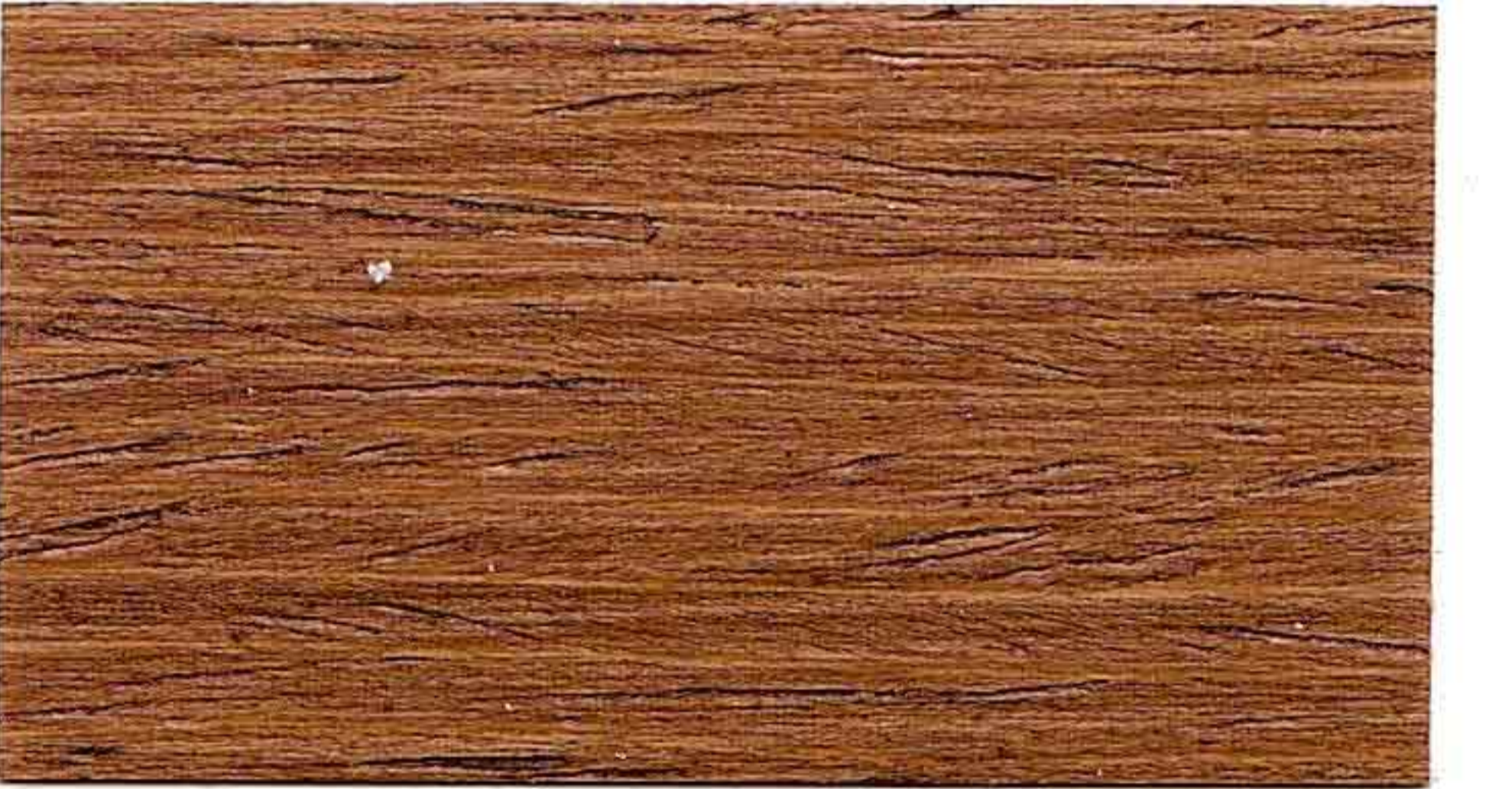
NOCE CHIARO 2° MANO