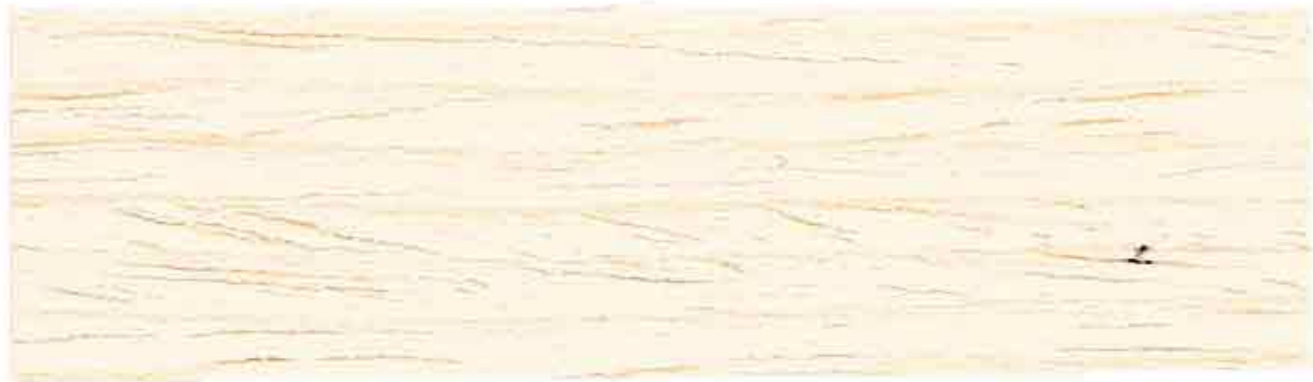
LEGNO NATURALE CHIARO

ГОТОВЫЕ ЦВЕТА - READY-MADE SHADES - COULEURS DEJA PRETES - GEBRAUCHSFERTIGE FARBEN COLORES YA LISTOS - CULORI GATA DE UTILIZARE - ΕΤΟΙΜΕΣ ΑΠΟΧΡΩΣΕΙΣ