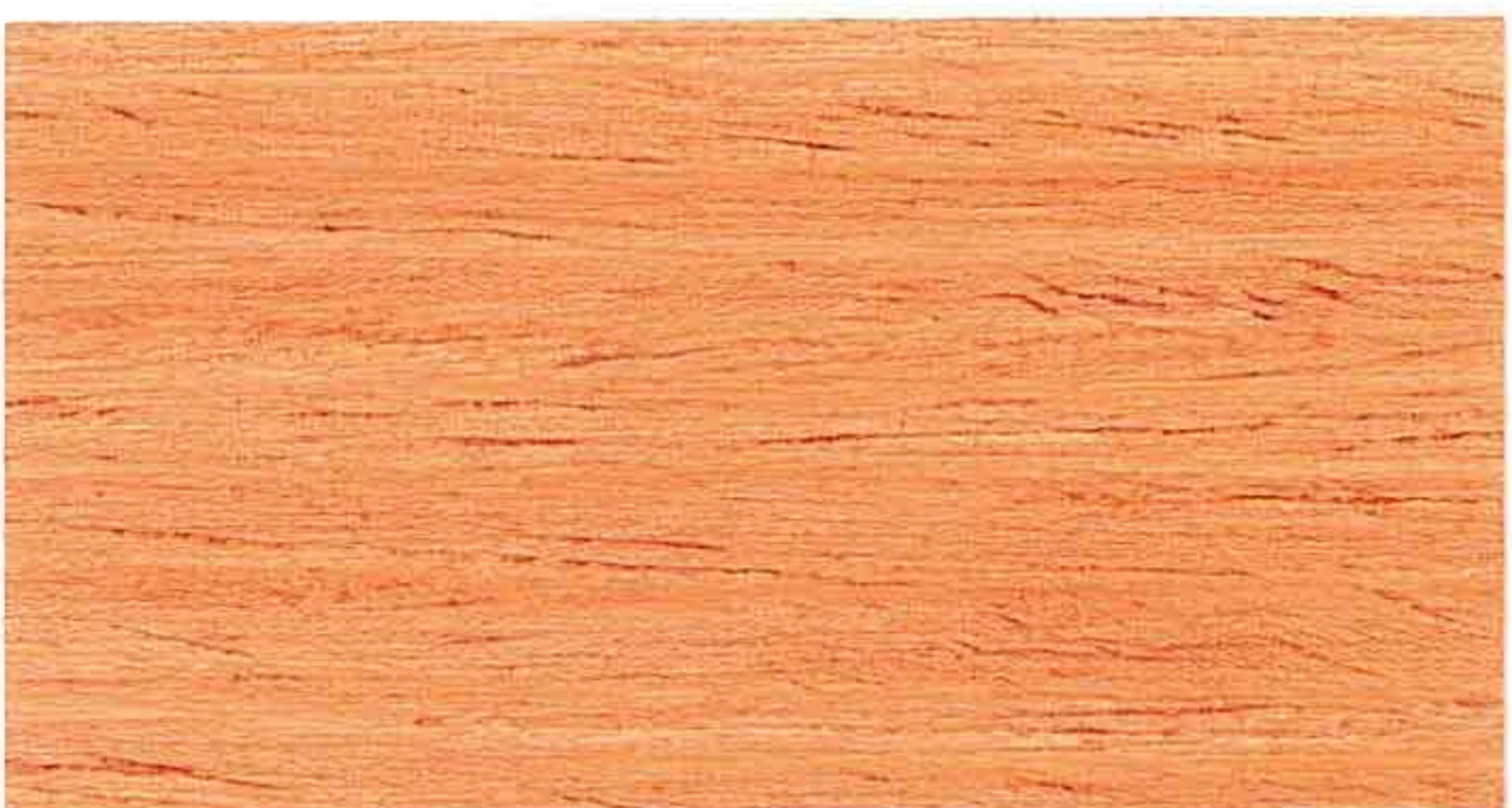
RED WOOD 1° MANO