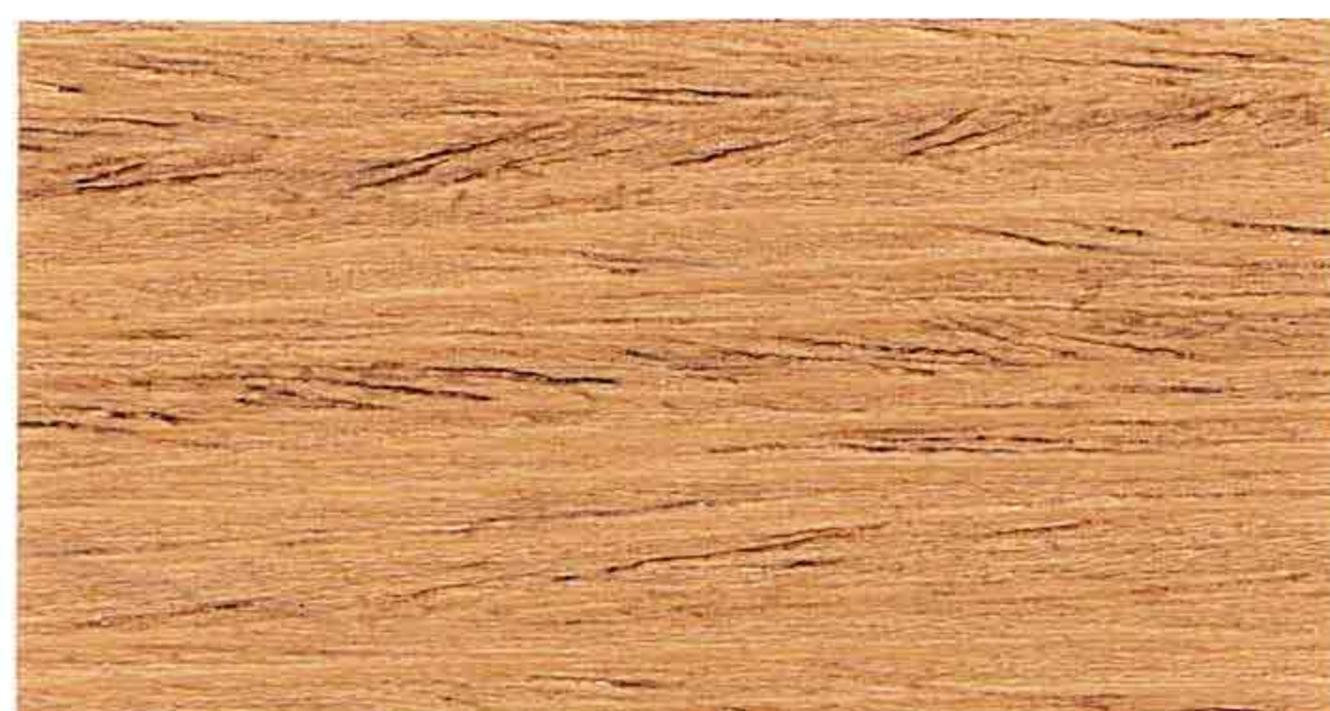
ROVERE 1° MANO