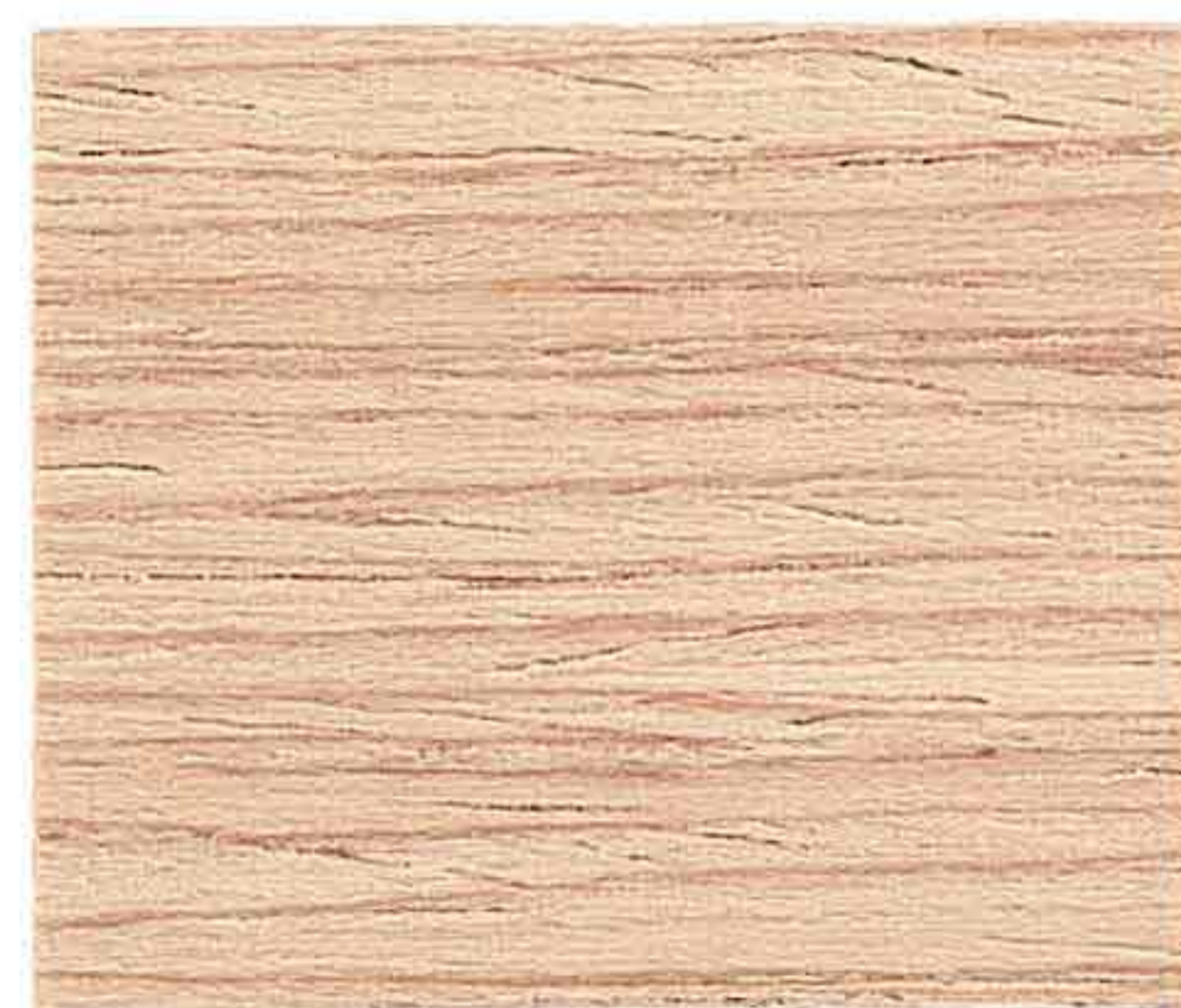
LEGNO NATURALE MEDIO