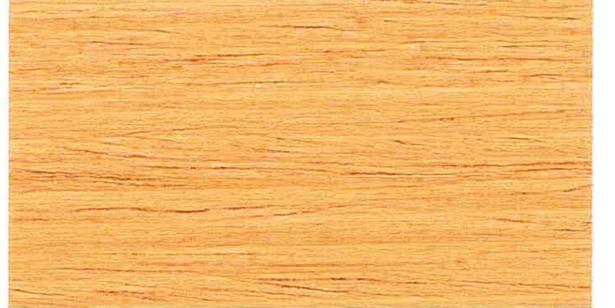
DOUGLAS 2° MANO