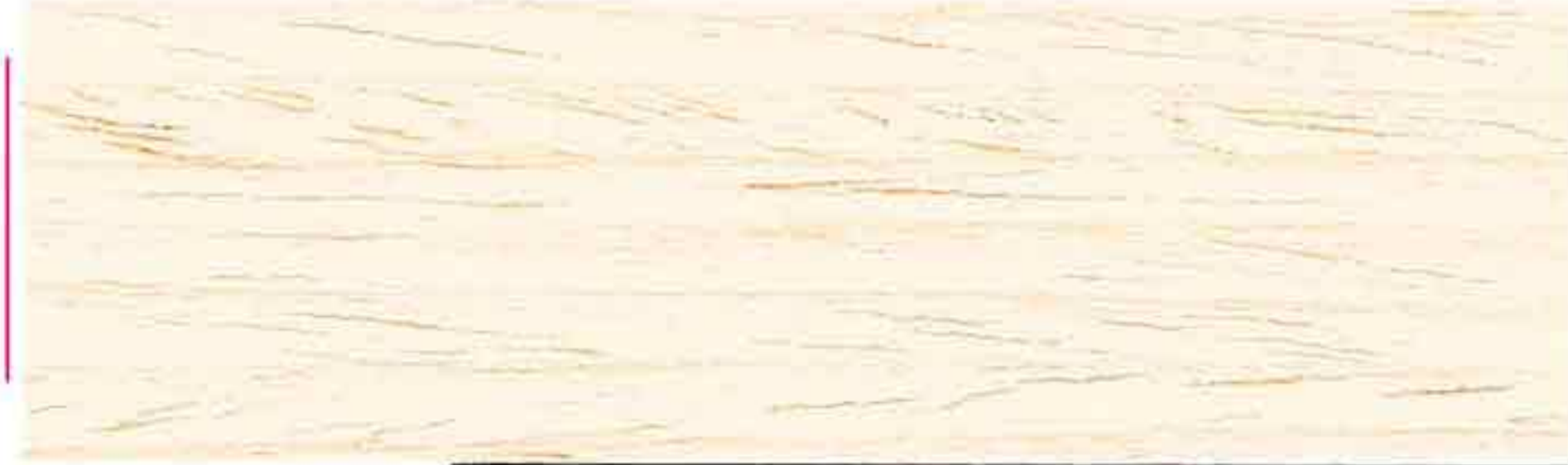
LEGNO NATURALE CHIARO