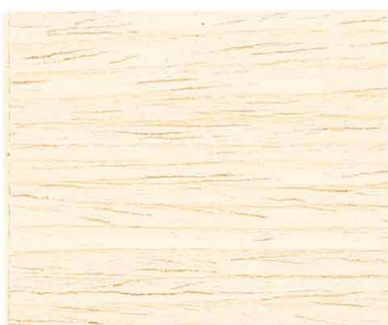
LEGNO NATURALE CHIARO

ПРОДУКТИВНОСТЬ НА РАЗЛИЧНЫХ ТИПАХ ДЕРЕВА - YIELD ON DIFFERENT TYPES OF WOOD - RENDEMENTS DIFFERENTS TYPES DE BOIS ERGIEBIGKEIT AUF VERSCHIEDENEN HOLZARTEN - RENDIMIENTO EN DIFERENTES TIPOS DE MADERA RANDAMENTUL PENTRU DIFERITE TIPURI DE LEMN - ΑΠΟΔΟΣΗ ΣΕ ΔΙΑΦΟΡΕΤΙΚΟΥΣ ΤΥΠΟΥΣ ΞΥΛΟΥ