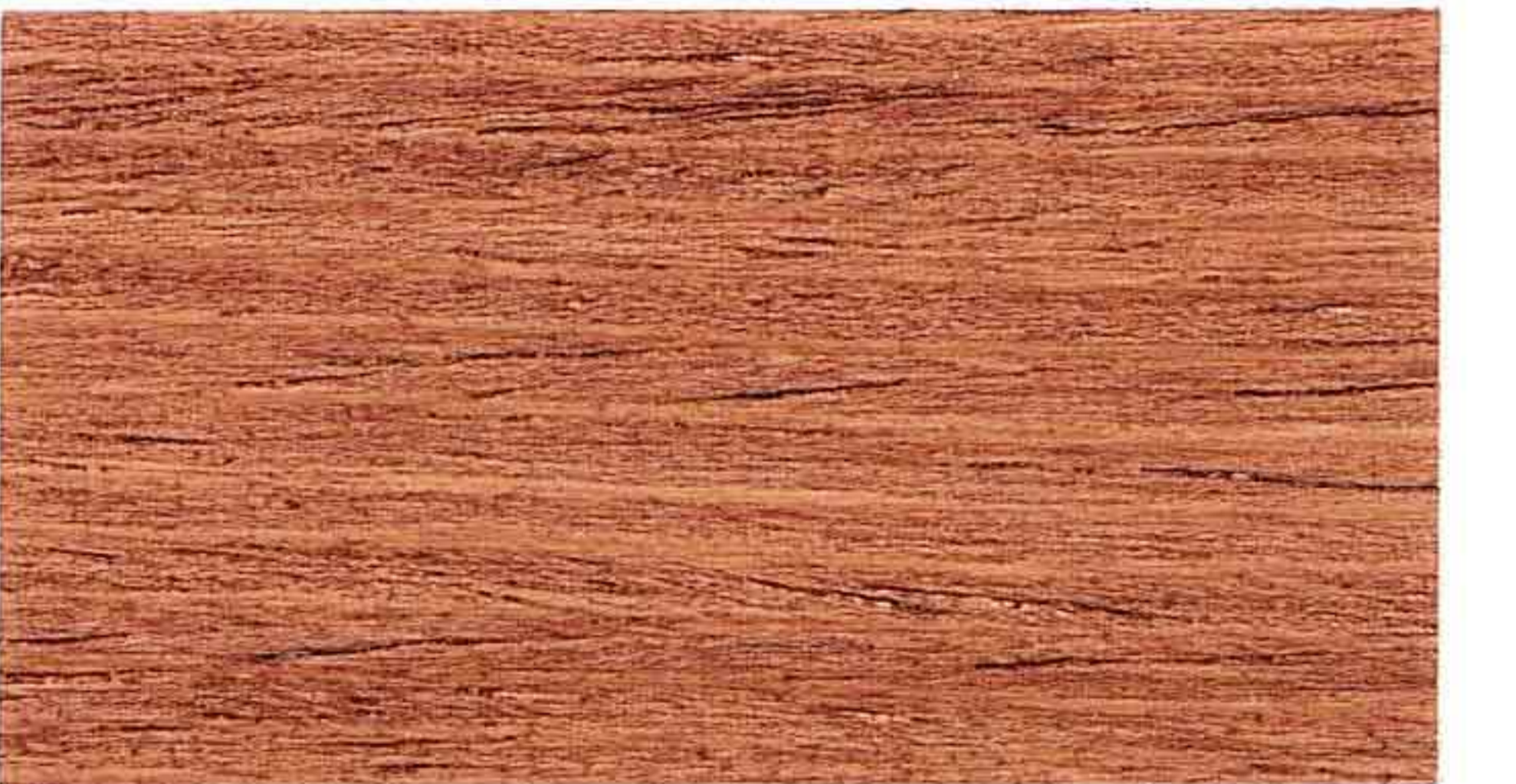
MOGANO 1° MANO