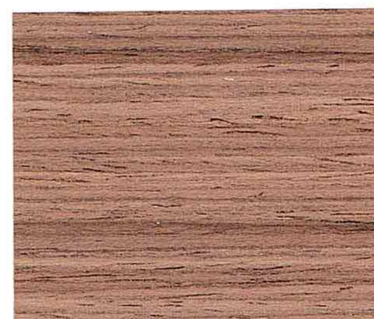
LEGNO NATURALE SCURO