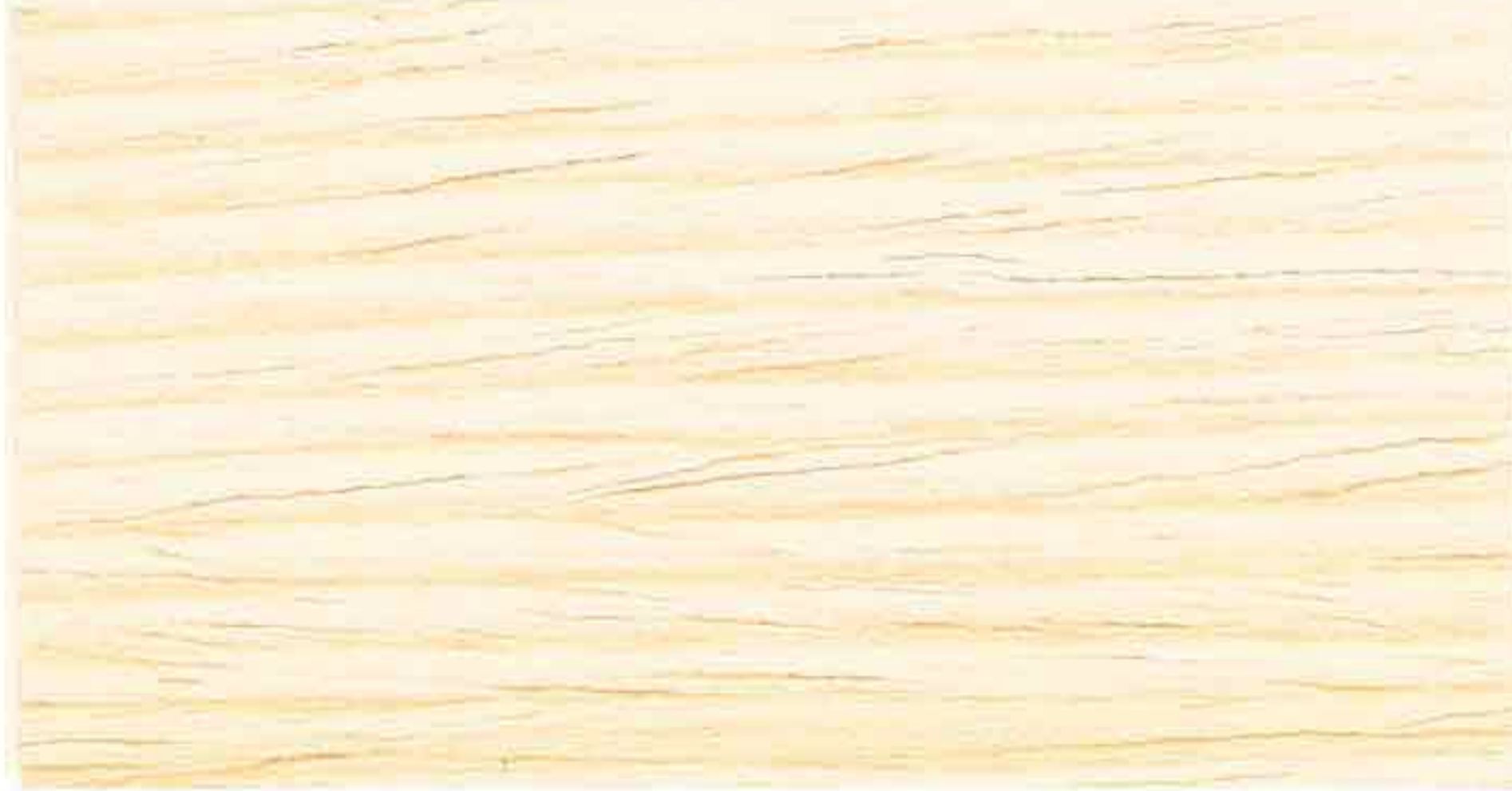
INCOLORE 1° MANO