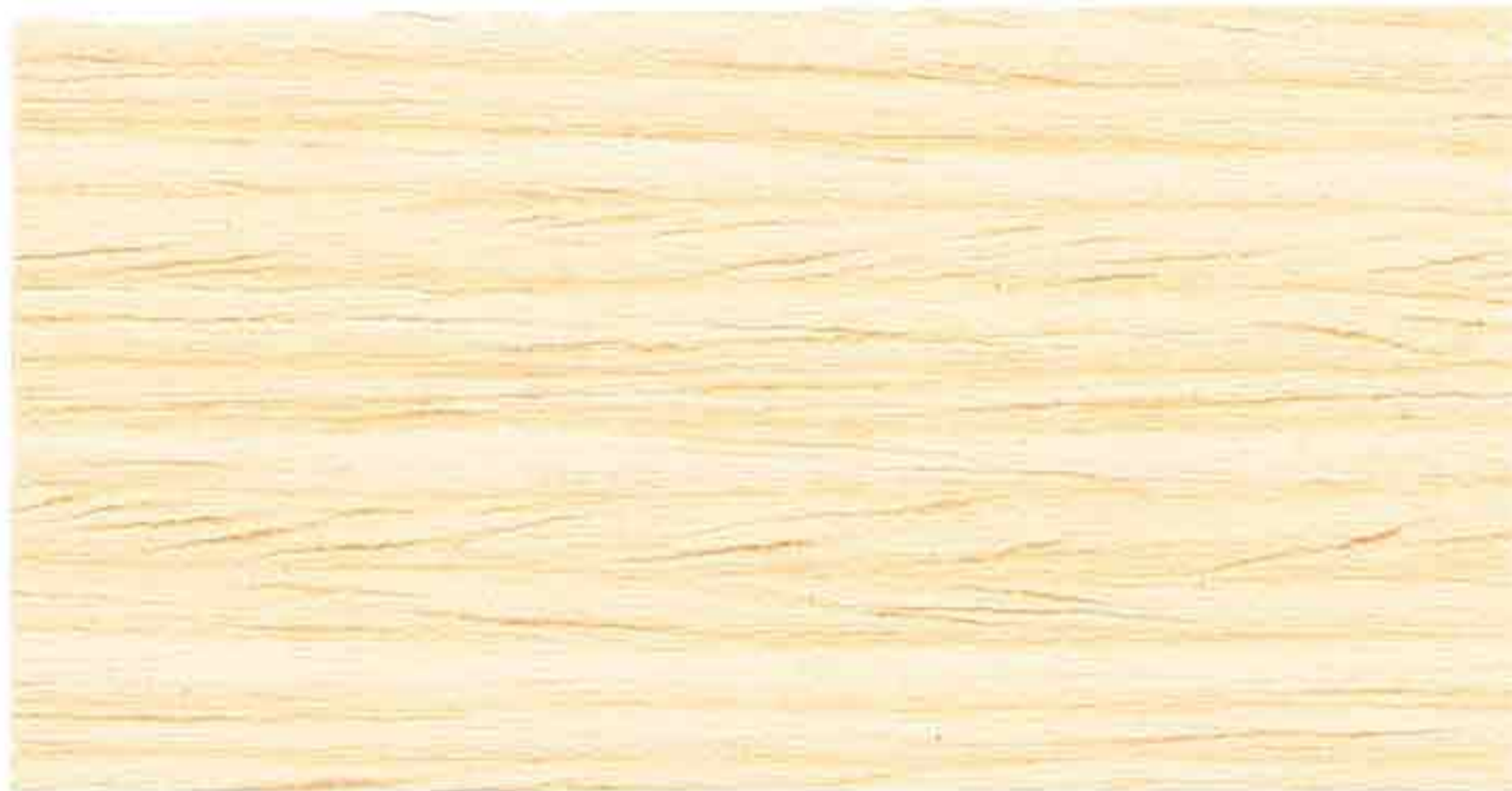
INCOLORE 2° MANO