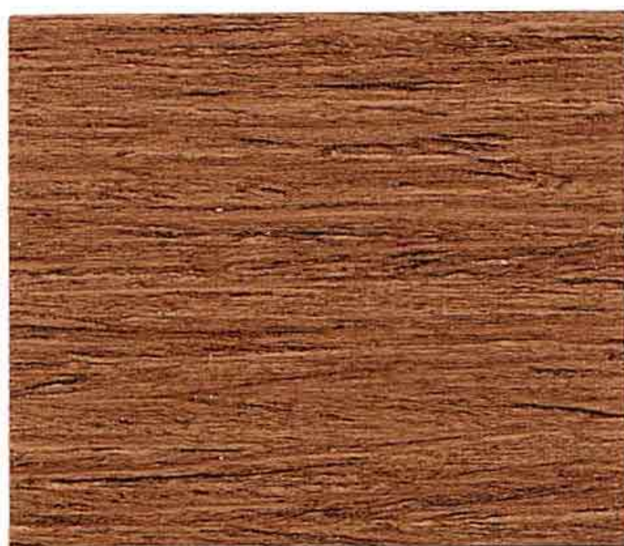
NOCE CHIARO 1° MANO