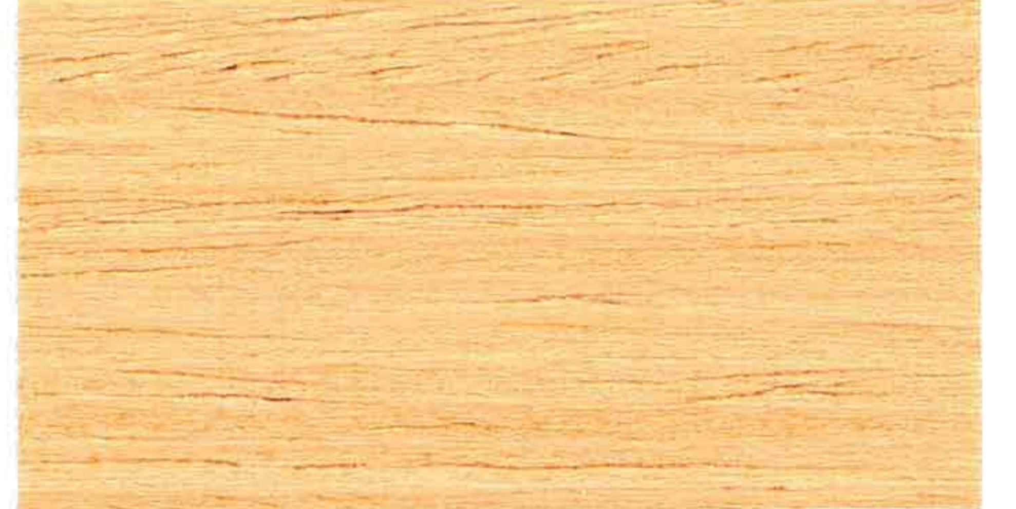
DOUGLAS 1° MANO