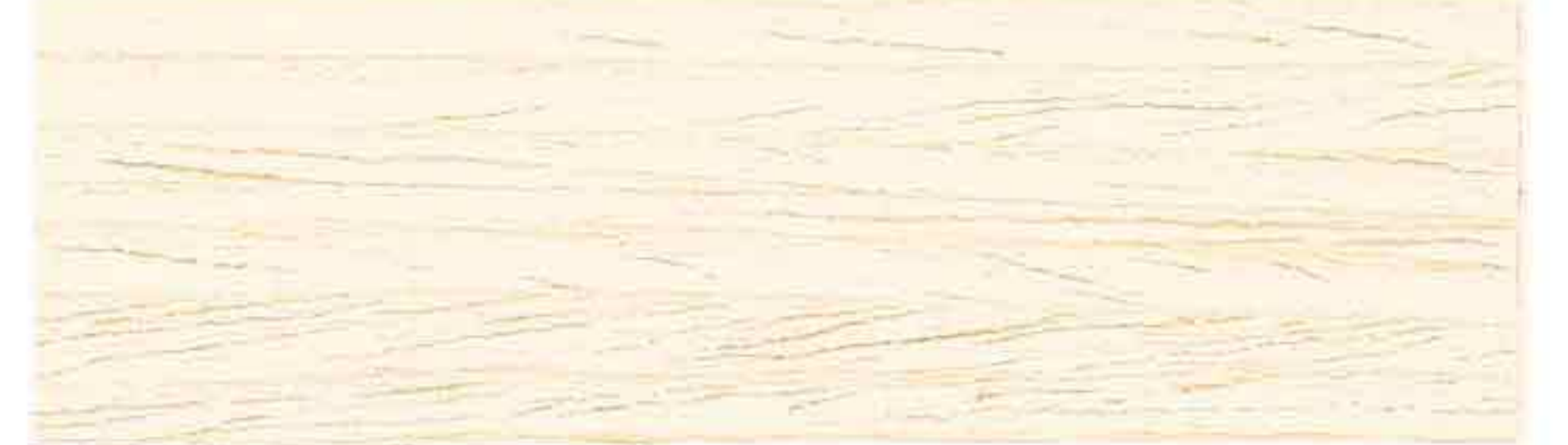
LEGNO NATURALE CHIARO