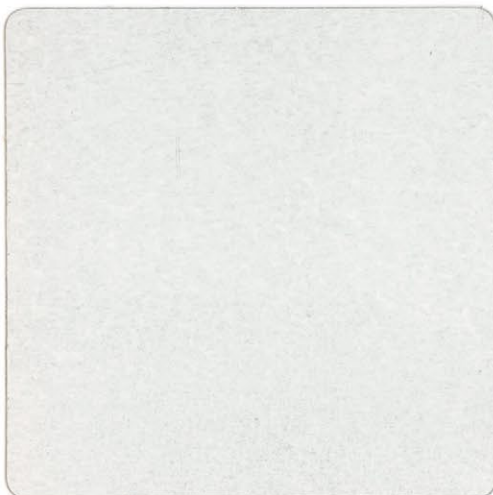
DOMUS PRIMER ACRILICO D2

Fissativo a base di una dispersione acrilica a particelle finissime, appositamente studiato per il ciclo Elastomerico Anticrepe. Dotato di eccezionale potere di penetrazione su tutti i supporti murali e perfettamente compatibile con gli altri prodotti del ciclo, ai quali garantisce una perfetta adesione. Applicazione: pennello Scheda Tecnica: H-15 Resa teorica: 10/13 mq/litro Colori disponibili: bianco, attintabile con paste coloranti serie 700